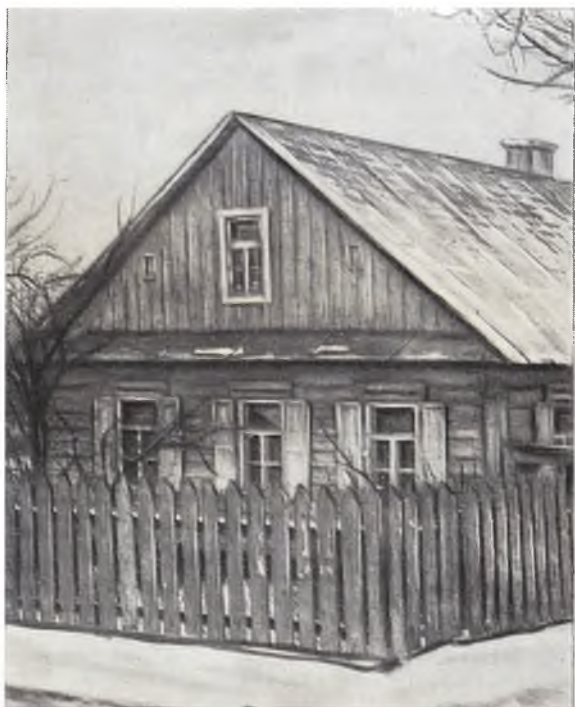
Дом в Минске, где проходил Первый съезд РСДРП