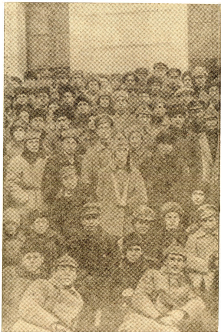
В. И. Ленин, К. Е. Ворошилов среди делегатов X съезда партии и кремлевских курсантов — участников подавления кронштадтского мятежа, 1921 год