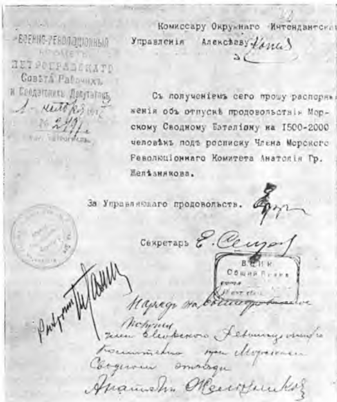
Предписание Военно-революционного комитета комиссару Округного интендантского управления 1 ноября 1917 г. См. док. № 1271.

находящегося на позиции у Красного Села, дер. Кураки и Рекулово, нижеследующее: