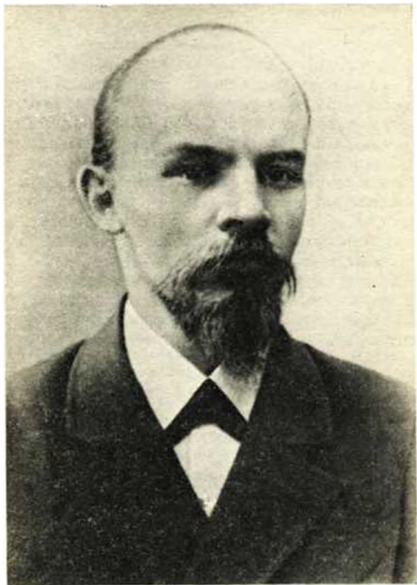
В. И. Ленин. 1900 г.