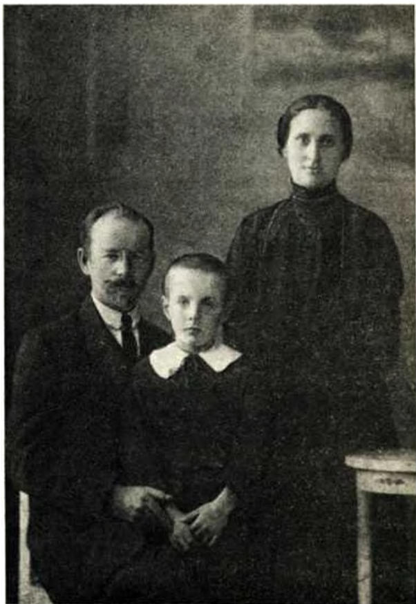
А. В. Шотман с женой и сыном. 1917 г. Публикуется впервые.