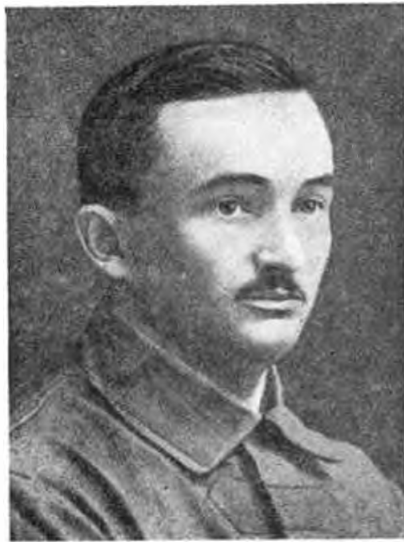
Шипек Адольф, командир 1-го Пензенского чехословацкого полка (1918 г.).