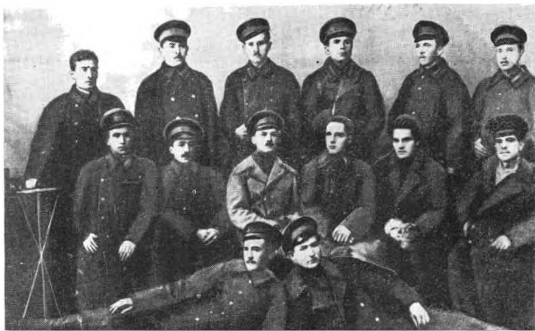
Марксистский кружок болгарских военнопленных-интернационалистов (г. Инсар Пензенской губ., ноябрь 1917 г.). Сидит второй справа Георгий Михайлов Добря, ныне депутат Народного собрания Народной Республики Болгарии.