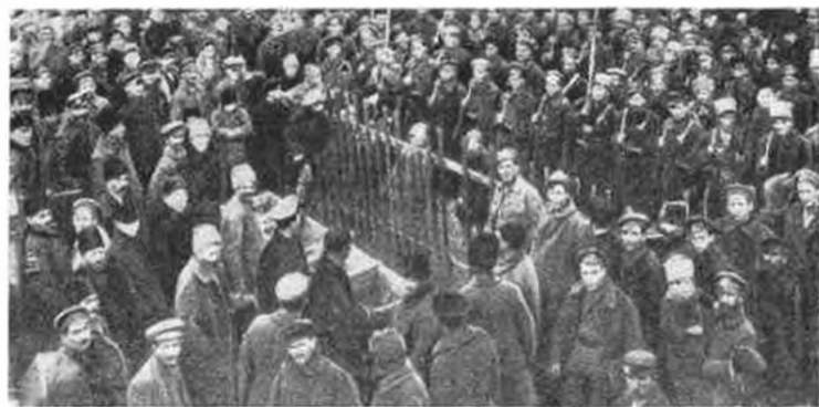
На фотографиях: вверху — командный состав китайского батальона 29-й стрелковой дивизии III армии Восточного фронта (1918 г.); в середине — польская революционная рота в Иркутске (1918 г.); внизу — румынский революционный батальон перед отправкой на фронт (Одесса, март 1918 г.)