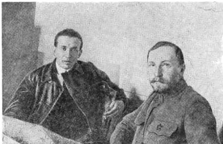
Видный деятель Венгерской советской республики Тибор Самузи и Народный Комиссар по военным делам Украины Н. И. Подвойский (май 1919 г.).