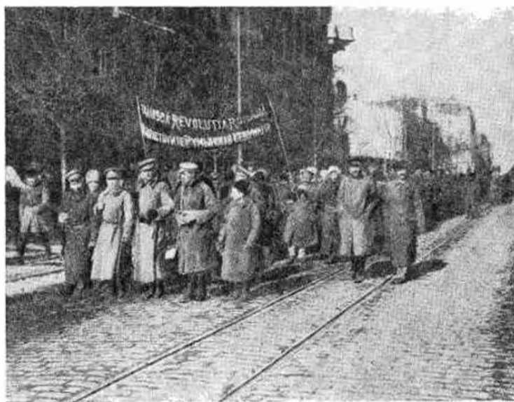
Румынский революционный батальон (Одесса, январь 1918 г.)