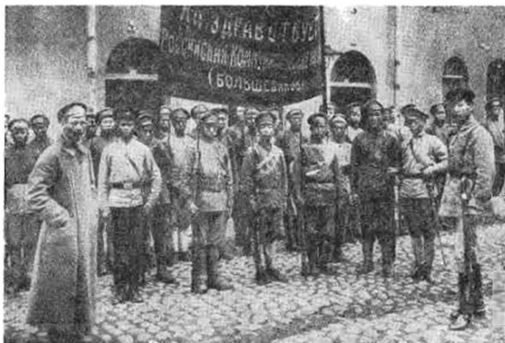
1-й интернациональный коммунистический китайский отряд перед отправкой на фронт (1918 г.)