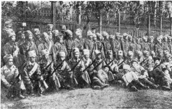
Бойцы китайского батальона (Восточный фронт, 1918 г.).