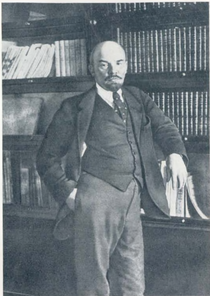
В. И. Ленин в рабочем кабинете. 1918 г.