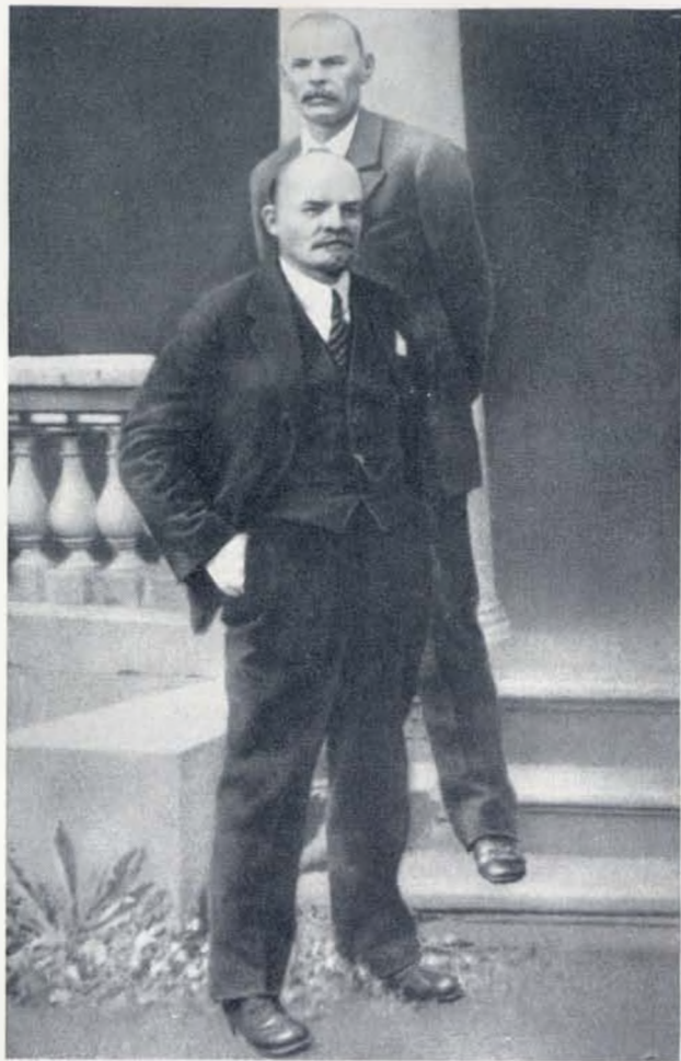
В. И. Ленин и А. М. Горький. 1920 г.