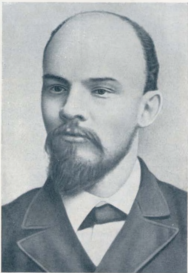
В. И. Ленин в 90-е годы