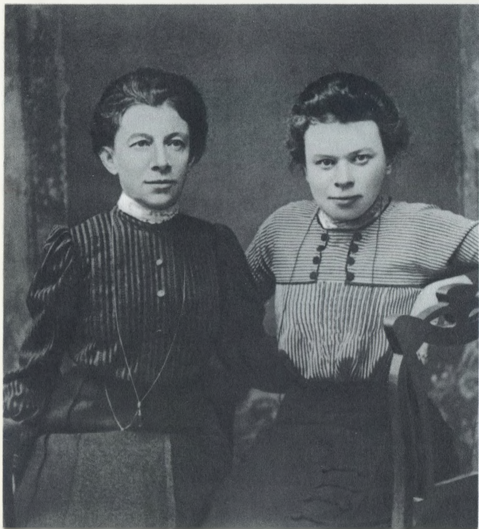
А. И. Ульянова-Елизарова и М. И. Ульянова 1912 г.