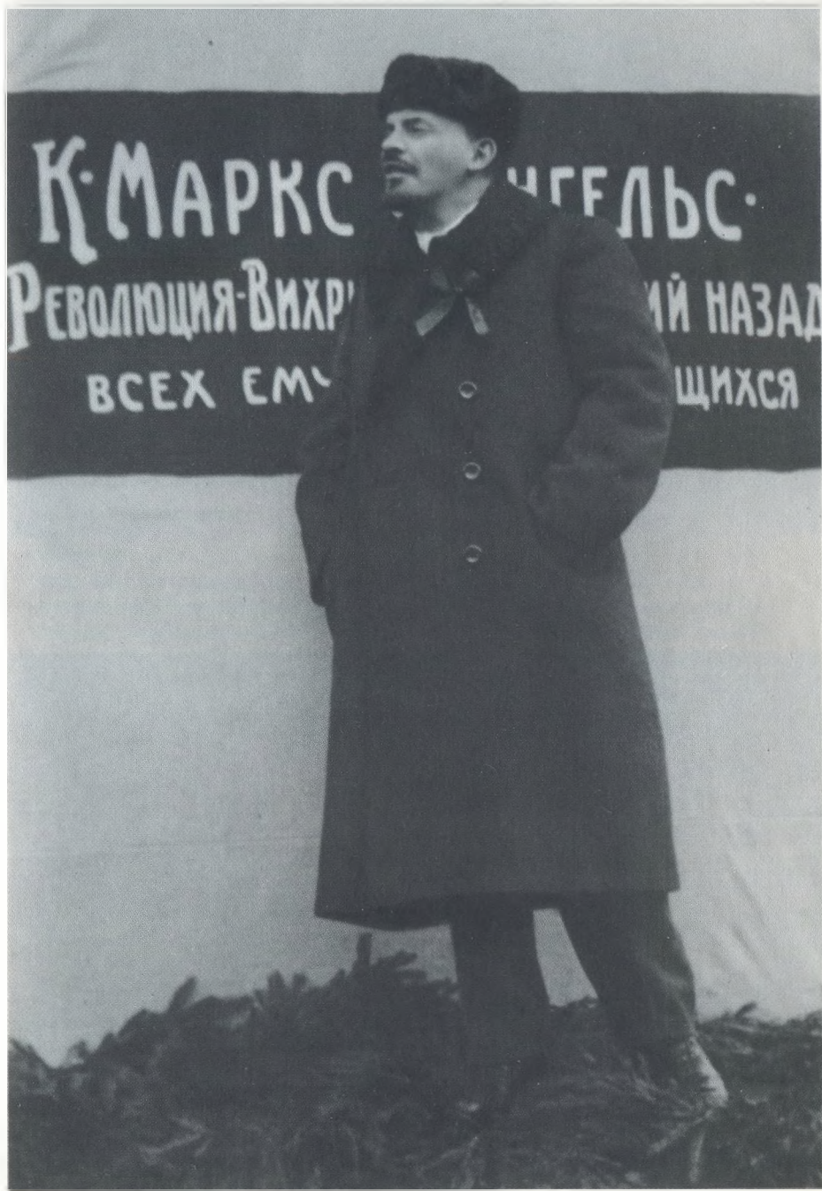
В. И. Ленин произносит речь при открытии памятника К. Марксу и Ф. Энгельсу 7 ноября 1918 г.