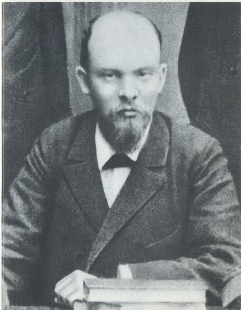
В. И. Ульянов 1897 г.