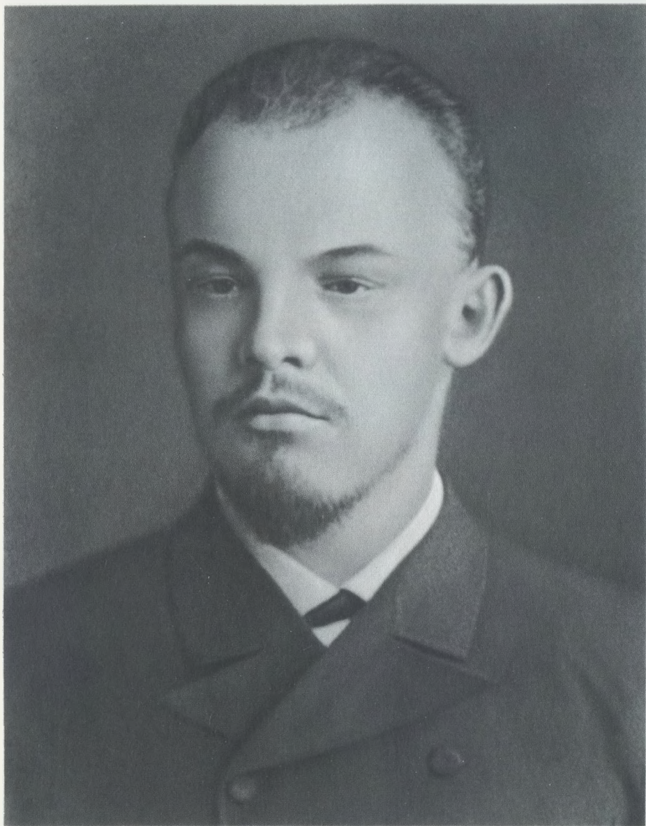
В. И. Ульянов 1891 г.