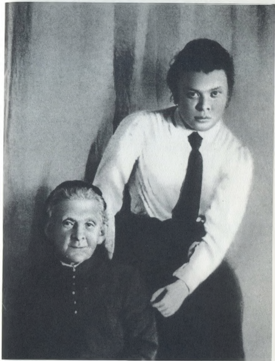
М. А. и М. И. Ульяновы 1913 г.