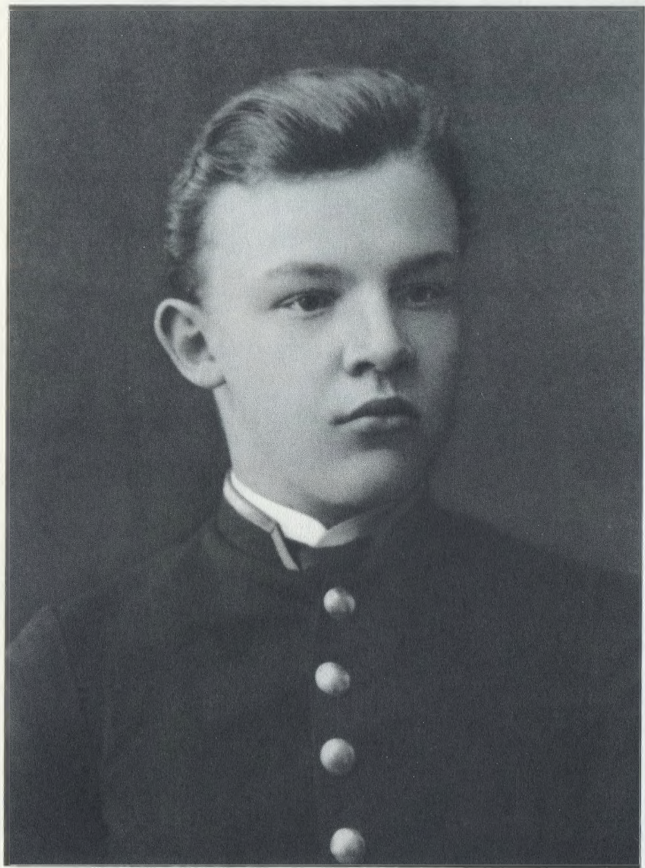
Владимир Ульянов 1887 г.