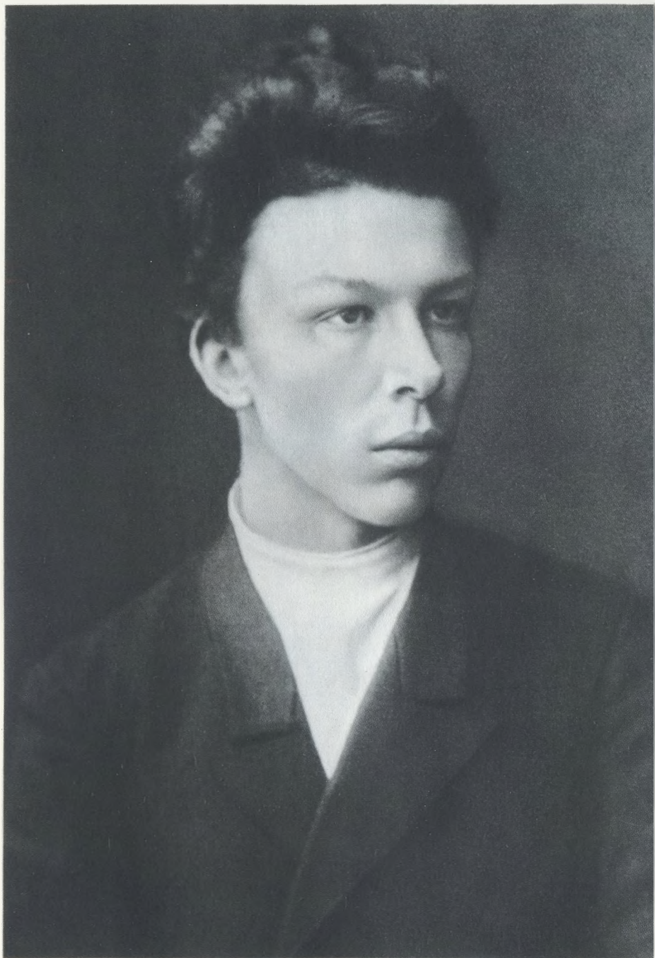
Александр Ульянов 1887 г.