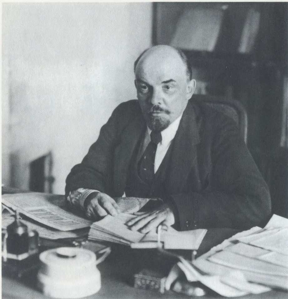
В. И. Ленин за рабочим столом в своем кабинете в Кремле 16 октября 1918 г.