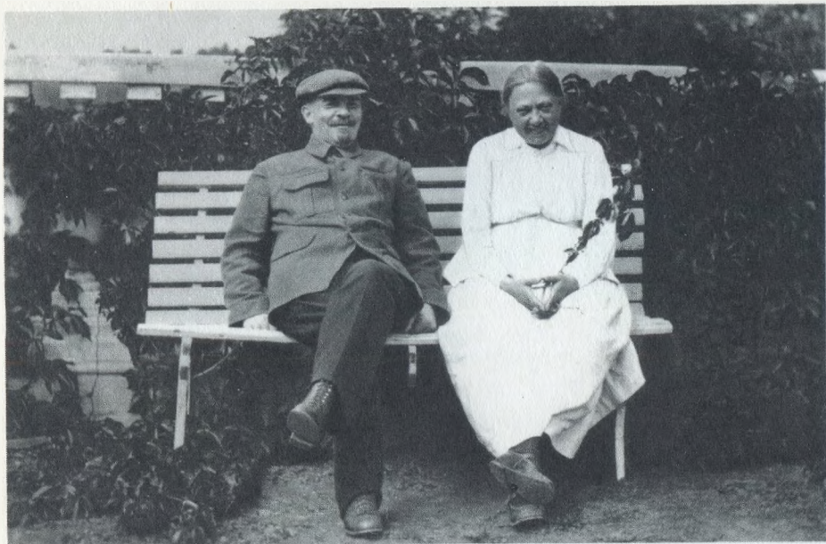
В. И. Ленин и Н. К. Крупская в Горках 1922 г.