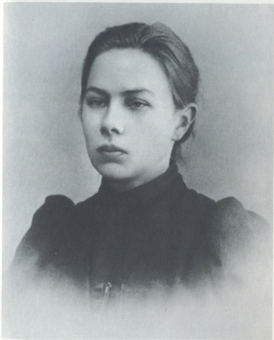
Н. К. Крупская 1895 г.