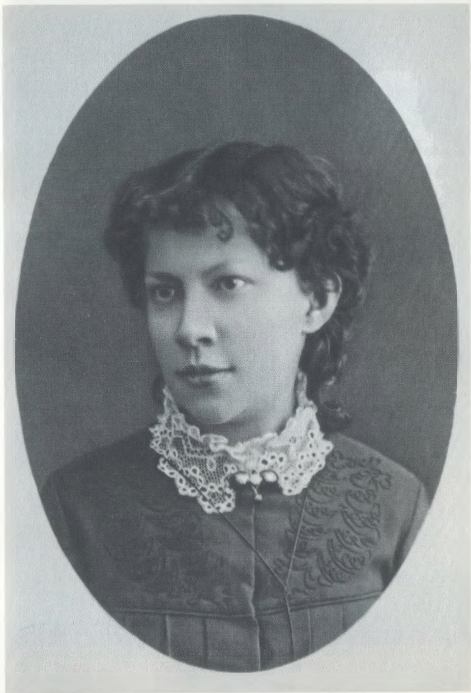
Анна Ульянова 1883—1887 гг.