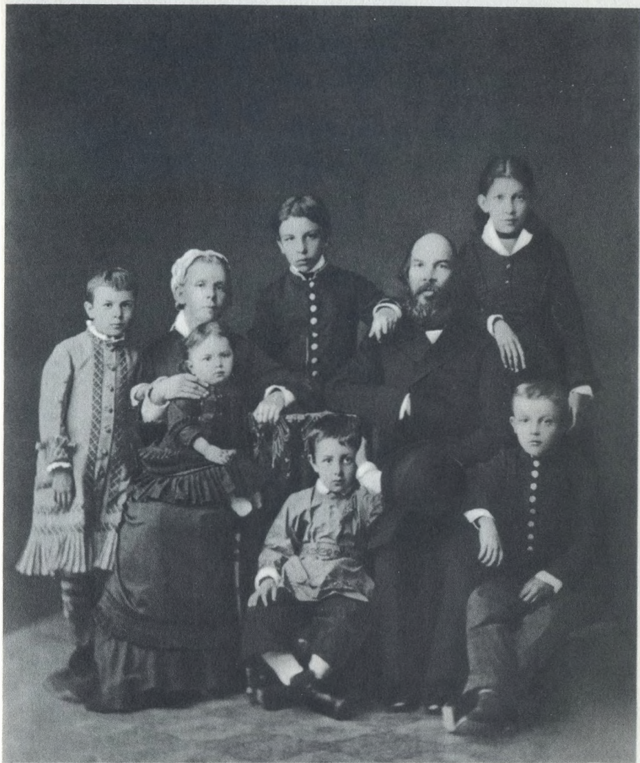
Семья Ульяновых 1879 г. Мария Александровна, Илья Николаевич и их дети: Ольга, Мария, Александр, Дмитрий, Анна, Владимир.