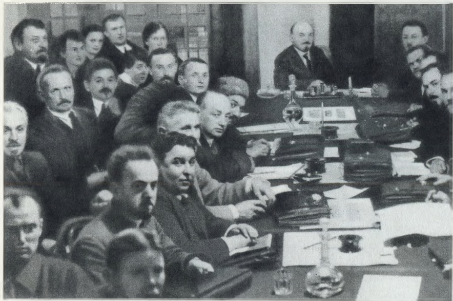
В. И. Ленин на заседании Совета Народных Комиссаров в Кремле. 3 октября 1922 г.