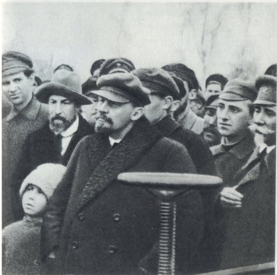
В. И. Ленин на испытании первого советского электропруга в учебно-опытном хозяйстве Московского высшего зоотехнического института 22 октября 1921 г.