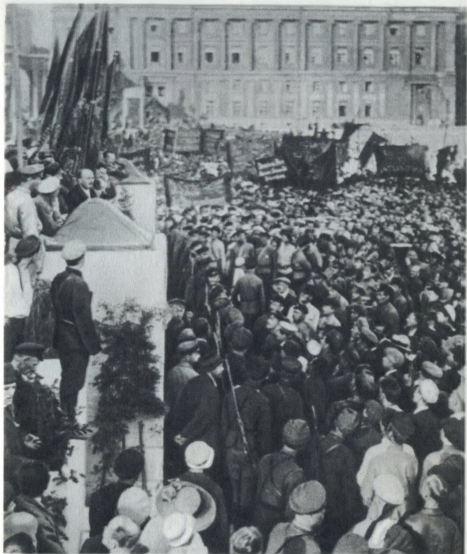
В. И. Ленин выступает на Дворцовой площади в Петрограде 19 июля 1920 г.