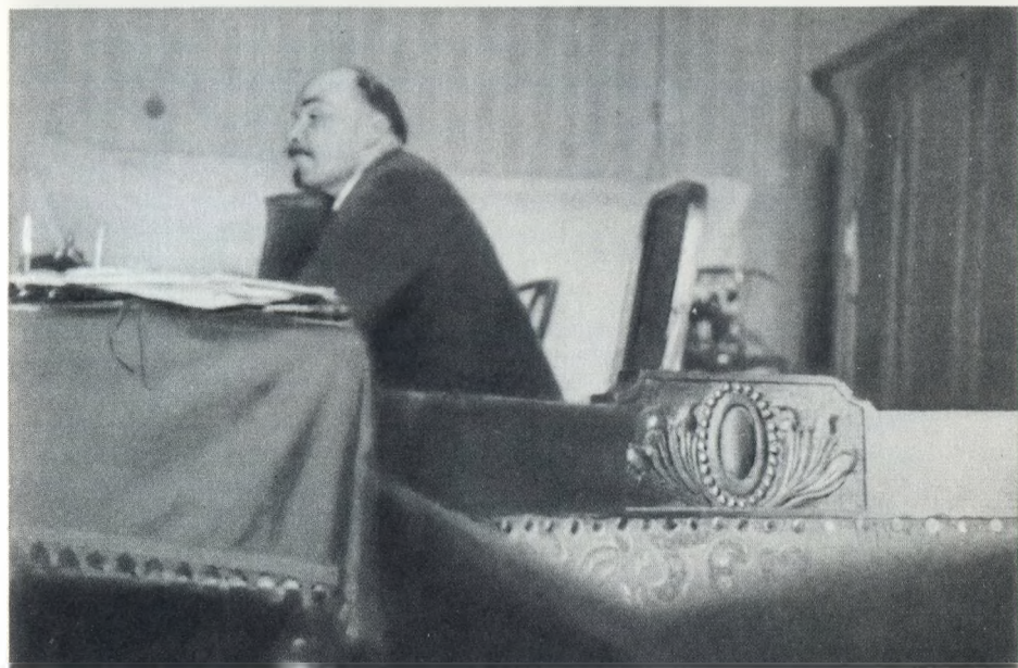
В. И. Ленин на заседании Пленума ЦК РКП(б) в Кремле. 5 октября 1922 г.