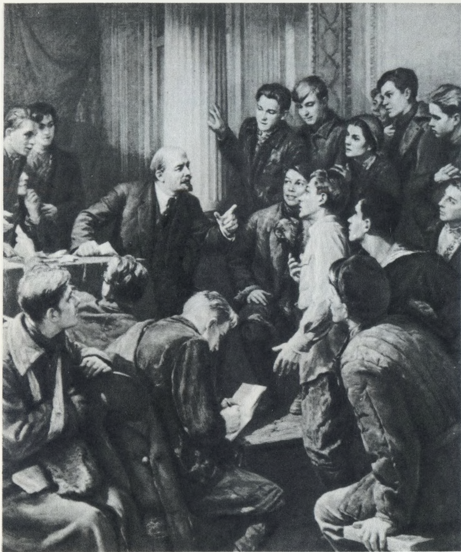
В. И. Ленин среди делегатов III съезда комсомола. Октябрь 1920 г. Художник П. Белоусов (Фрагмент)