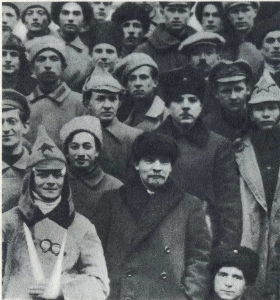
В. И. Ленин и К. Е. Ворошилов в группе делегатов X съезда РКП(б) — участников подавления кронштадтского мятежа. Март 1921 г.