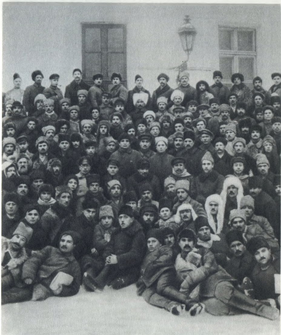
В. И. Ленин в группе делегатов II Всероссийского съезда горнорабочих в Кремле. Январь 1921 г.