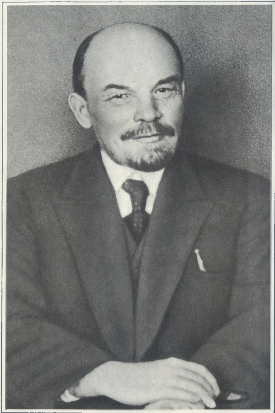
В. И. Ленин 1921 г.