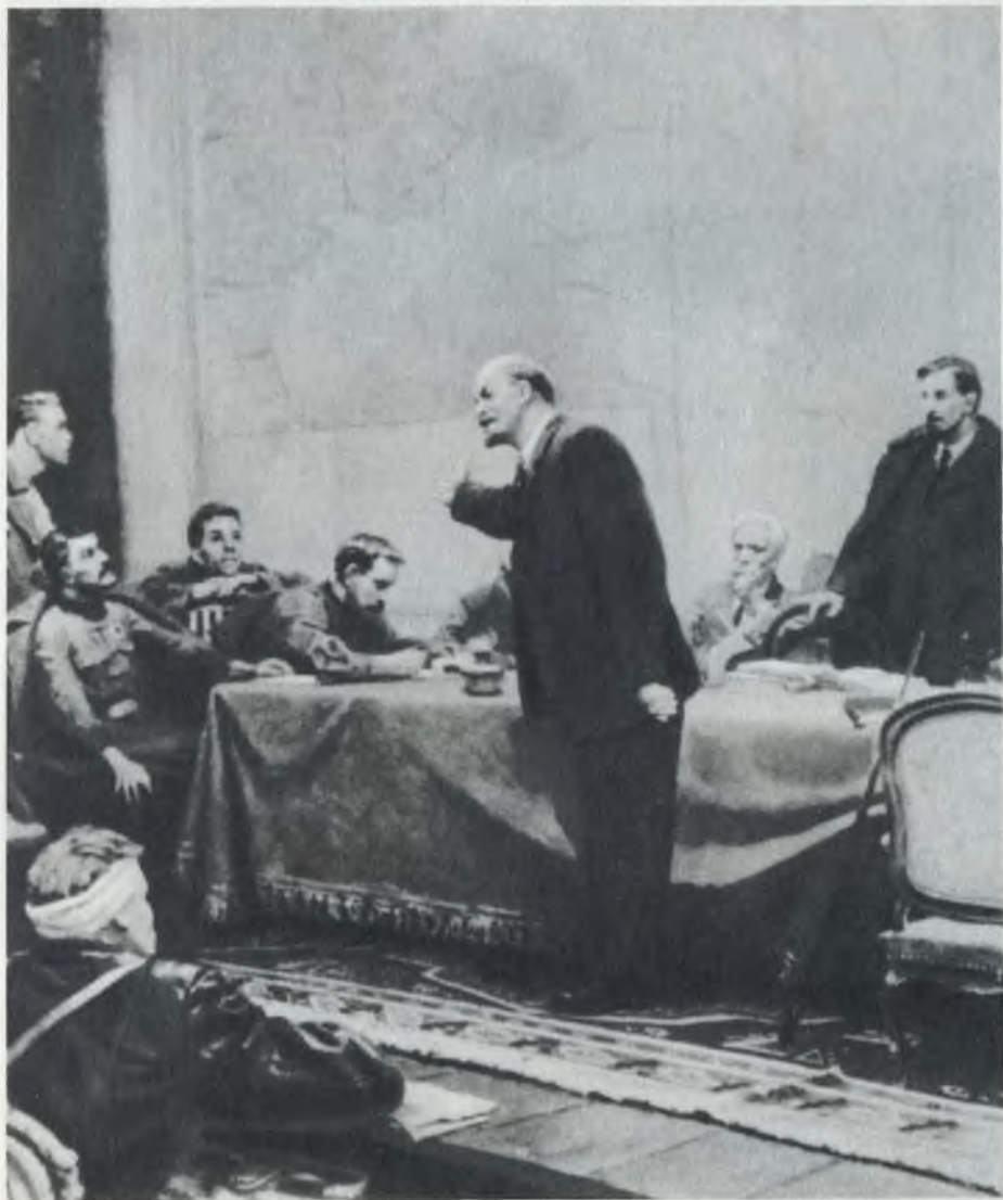
В. И. Ленин выступает на VIII Всероссийском съезде Советов. Декабрь 1920 г. Художник Л. Шматько (Фрагмент)