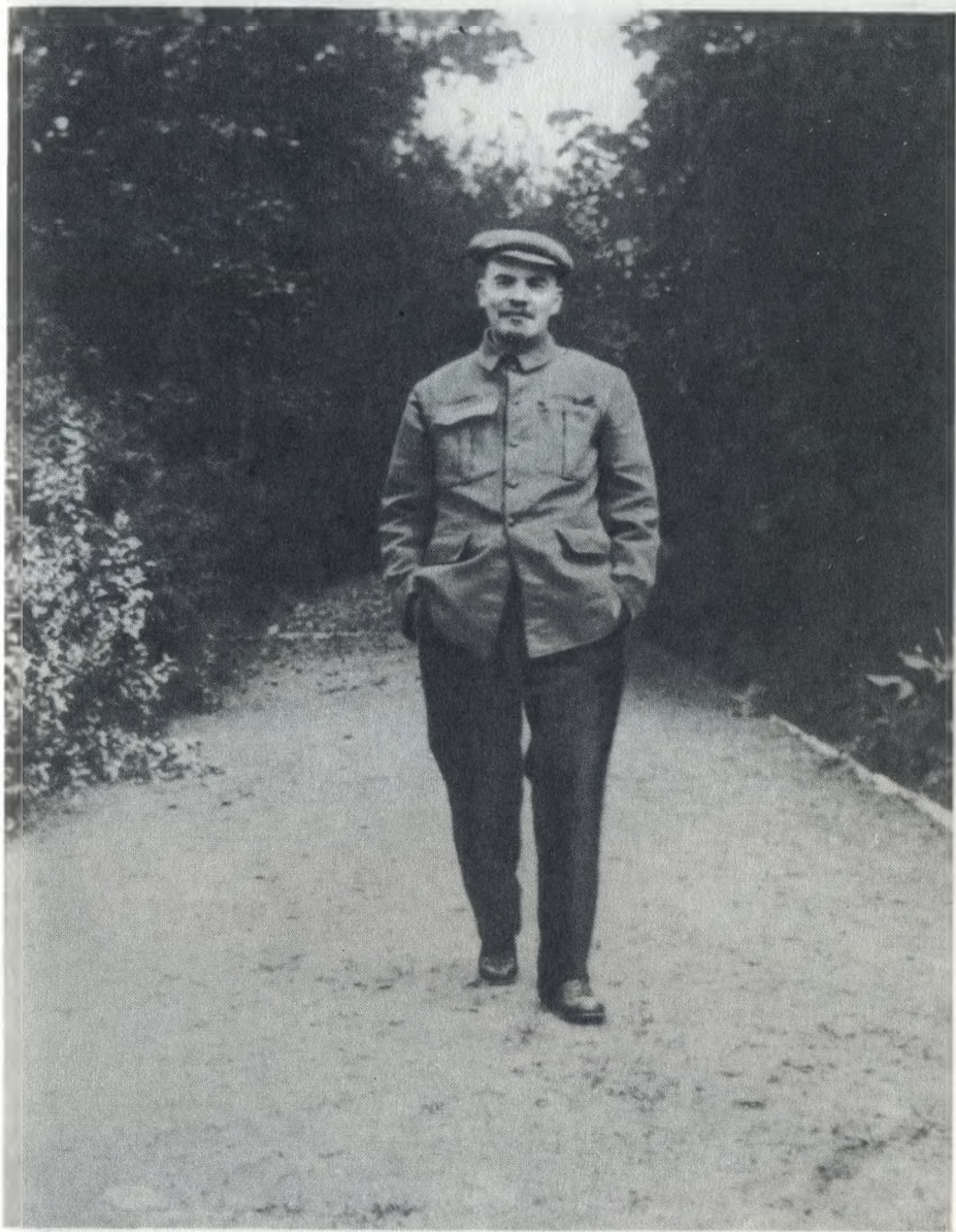
В. И. Ленин на прогулке в Горках. 1922 г.