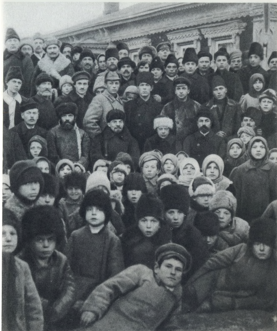
В. И. Ленин и Н. К. Крупская среди крестьян деревни Кашино в день открытия сельской электрической станции. Ноябрь 1920 г.