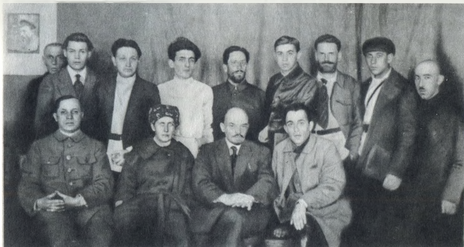
В. И. Ленин с группой сотрудников «Центропечати», работавших над записью его речей на грампластинки. 25 апреля 1921 г.