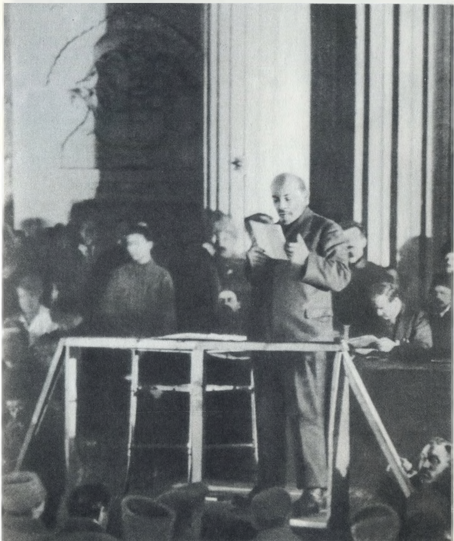
В. И. Ленин выступает с речью на заседании X съезда РКП(б). Март 1921 г.