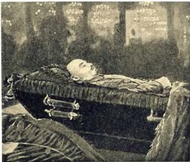
Ленин в гробу. (В траурные дни в Колонном зале Дома Союзов)