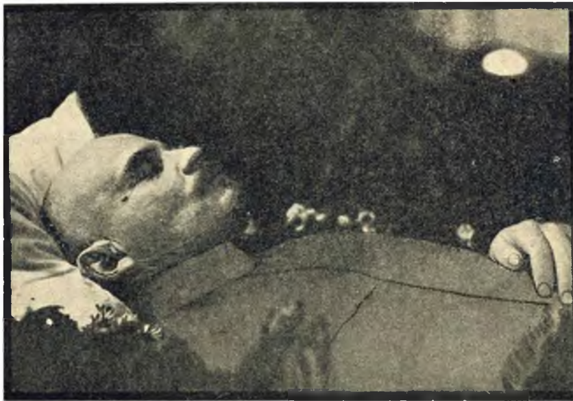
В. И. Ленин на смертном одре.