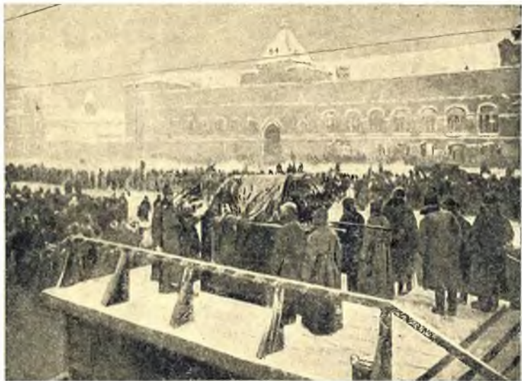
Гроб Ленина на Красной площади.