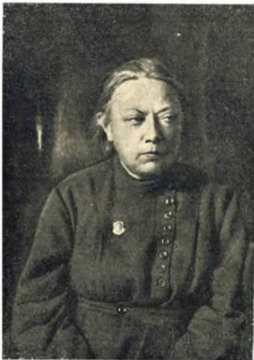
Н. К. Крупская.