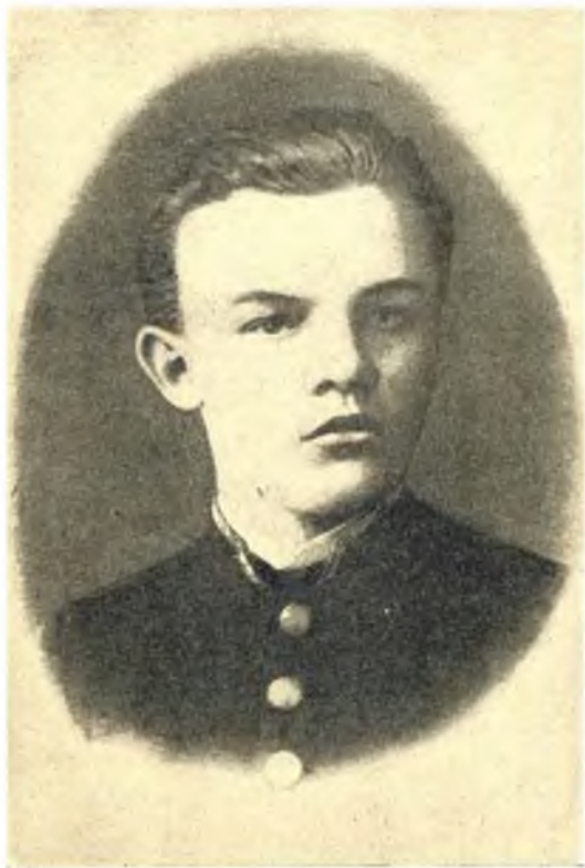
Ленин в школьные годы (1887 г.).