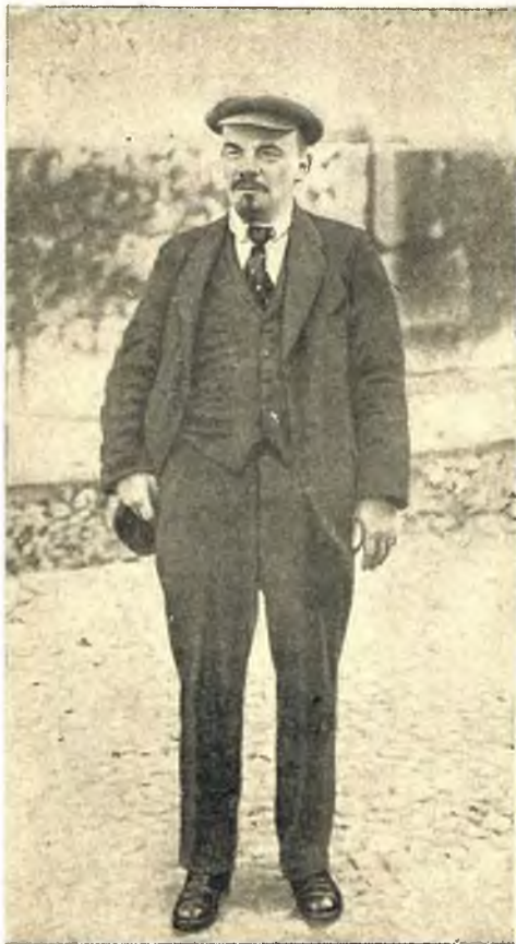
Ленин на прогулке.