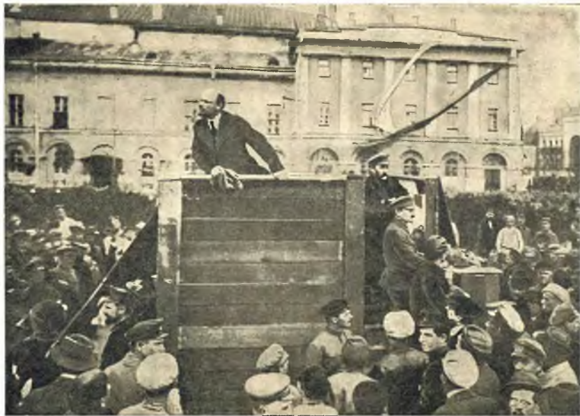
Ленин на трибуне на площади Свердлова в Москве.