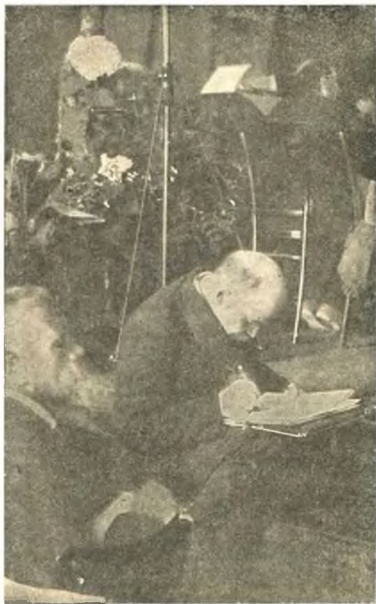
Ленин за работой. (На X Съезде Р. К. П.)