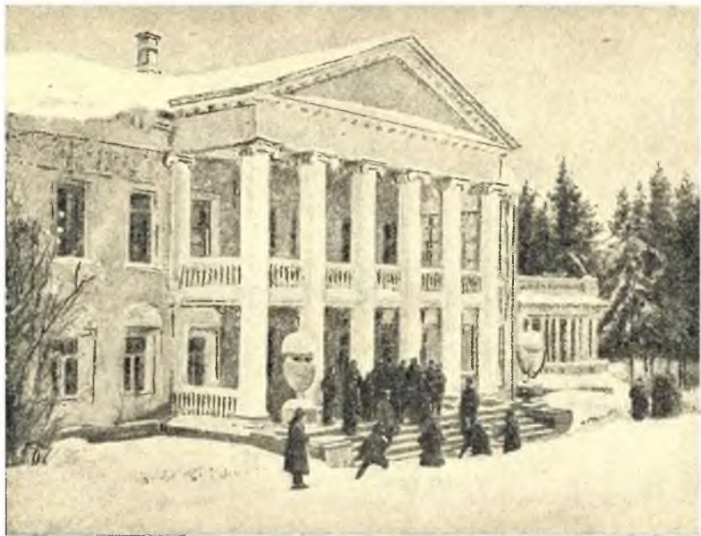
Дом в «Горках», где отдыхал, лечился и умер Ленин.