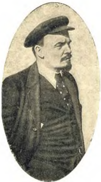
В. И. Ленин.