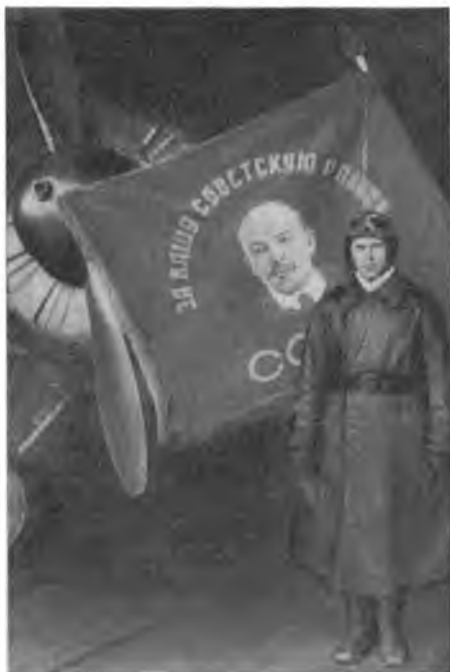
Герой Советского Союза гвардии капитан М. Я. Васильев у развернутого Знамени части. Август 1942 г.

За одитый самолет противника 18 августа 1942 года награжден Героем сов. союза гвардии капитаном Васильевым Михаилом Яковлевичем личным фото. снимком у развернутого гвардейского знамени части.