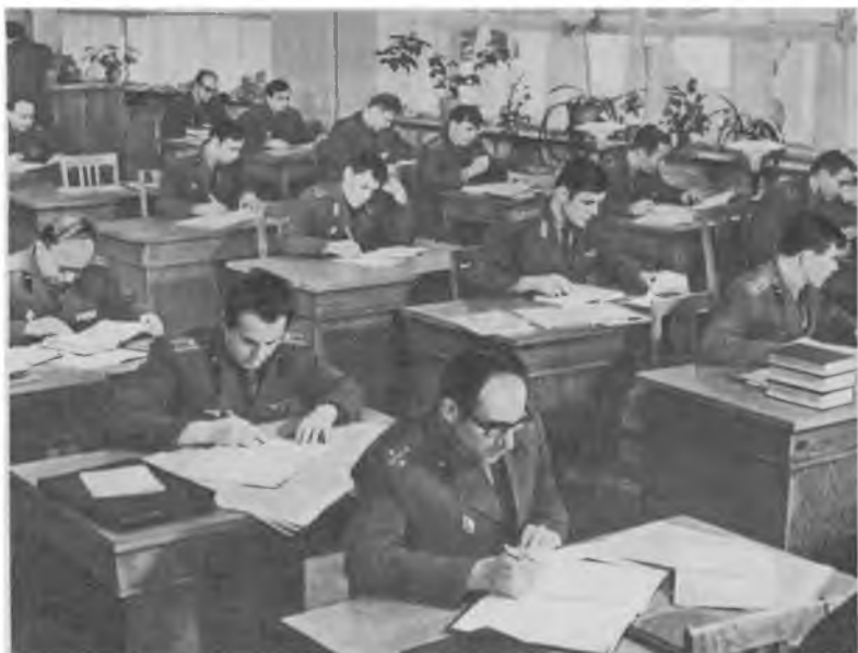
В аудитории Военно-политической академии имени В. И. Ленина — кузнице высококвалифицированных кадров политработников армии и флота.