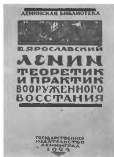
Книги о военной деятельности В. И. Ленина, изданные в 1924—1925 гг.