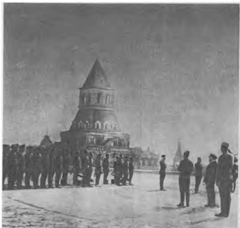
В. И. Ленин принимает перед одиннадцатого выпуска командиров Первых Московских советских пулеметных курсов в Кремле, Москва, 12 мая 1920 г.