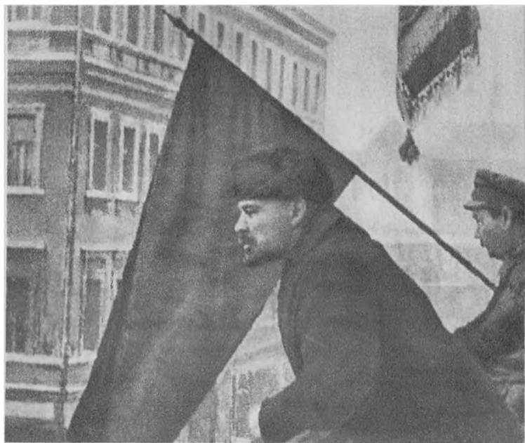
В. И. Ленин произносит речь с балкона Московского Совета перед рабочими-коммунистами, отправляющимися на Южный фронт. Москва, 16 октября 1919 г. Кинокадр.