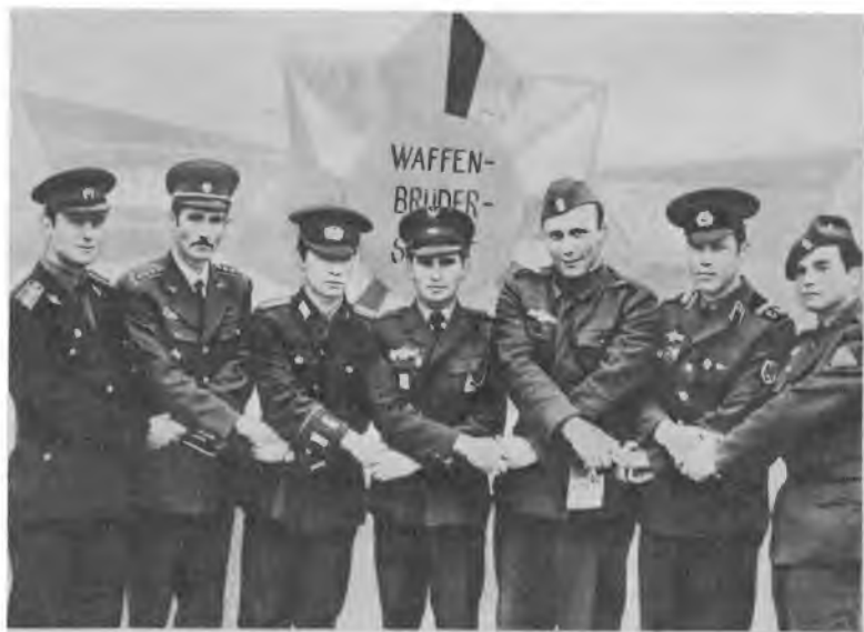
Воины армий социалистических стран — участники Варшавского Договора — братья по классу, братья по оружию.