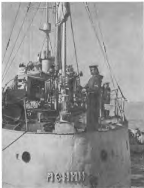
Канонерская лодка «Ленин». Краснознаменная Каспийская флотилия. 1947 г.