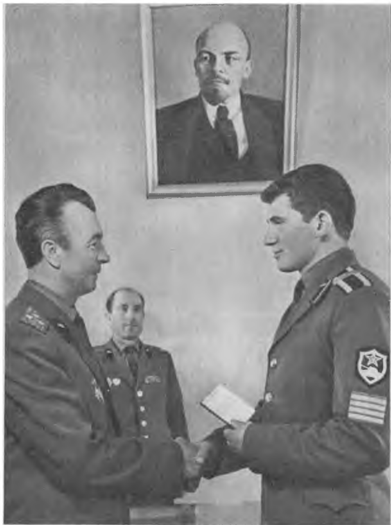
С вступлением в ряды ленинской партии!