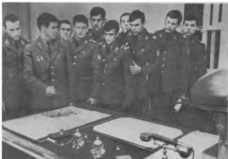
Воины в квартире-музее В. И. Ленина в Кремле.