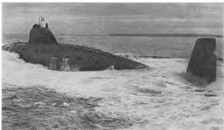
Курс — океан.