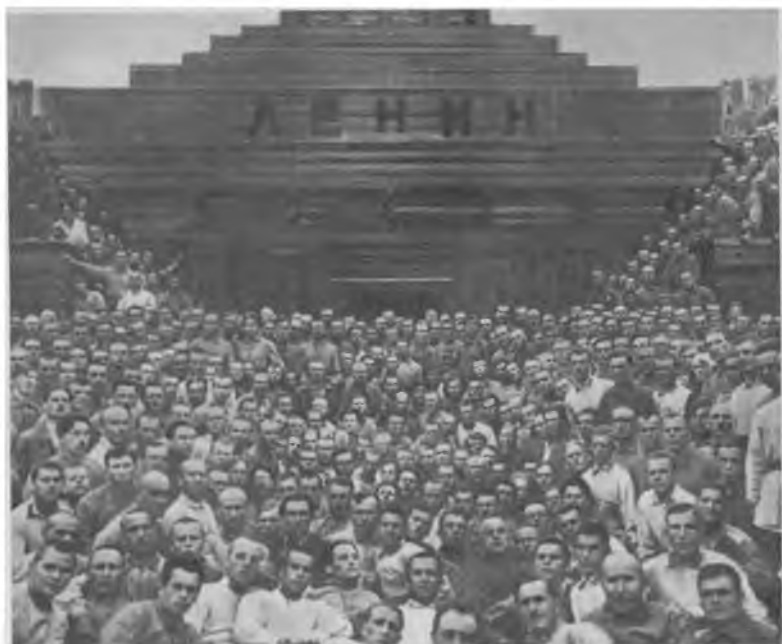
Делегаты партийной конференции Московского военного округа у Мавзолея В. И. Ленина. 1924 г.