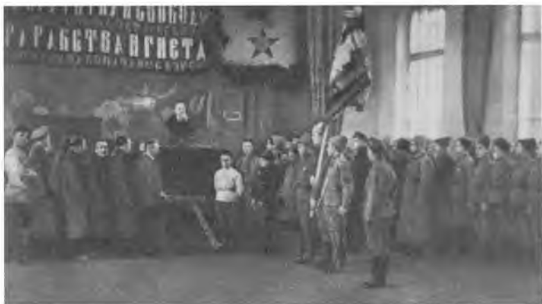
В. И. Ленин произносит речь на курсах командного состава тяжелой артиллерии Красной Армии при вручении курсантам Знамени Рогожским райкомом партии. Москва, 15 апреля 1919 г.