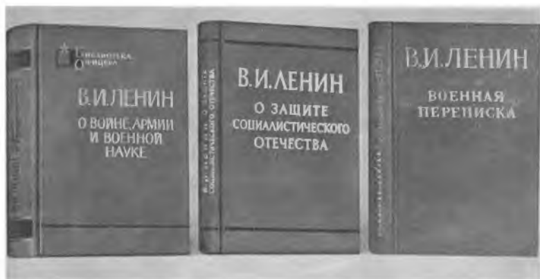
Неисчерпаемо военно-теоретическое наследие В. И. Ленина.