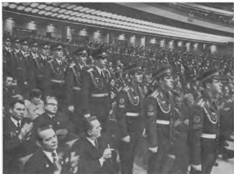
Москва. Кремлевский Дворец съездов. Делегатов и гостей XXV съезда КПСС приветствовала делегация Вооруженных Сил СССР.