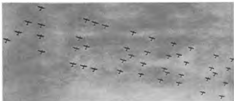
В День авиации 18 августа 1936 г. в Тушине.