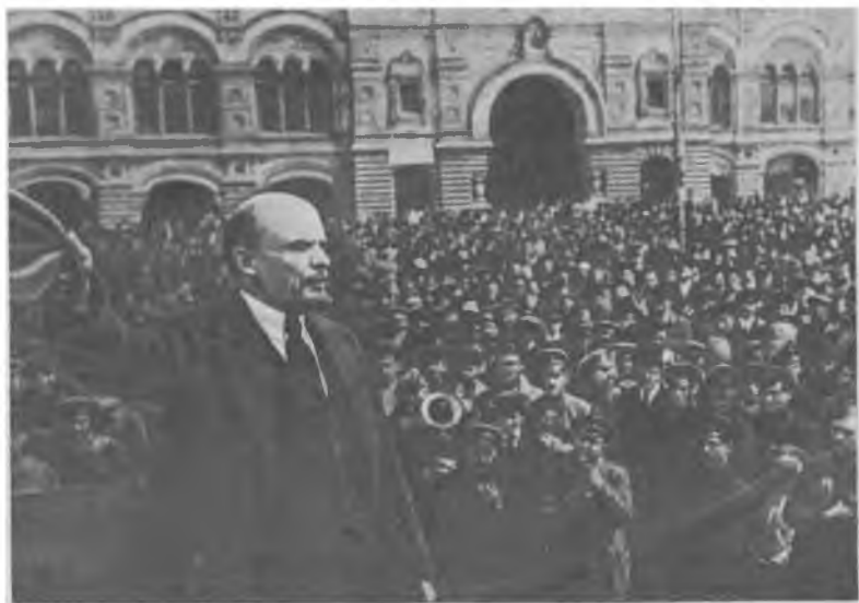
В. И. Ленин произносит речь перед войсками Всевобуча на Красной площади. Москва, 25 мая 1919 г.