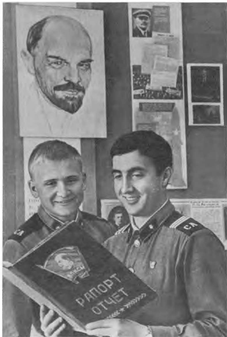
Имена лучших занесены в рапорт-отчет комсомольской организации подразделения.