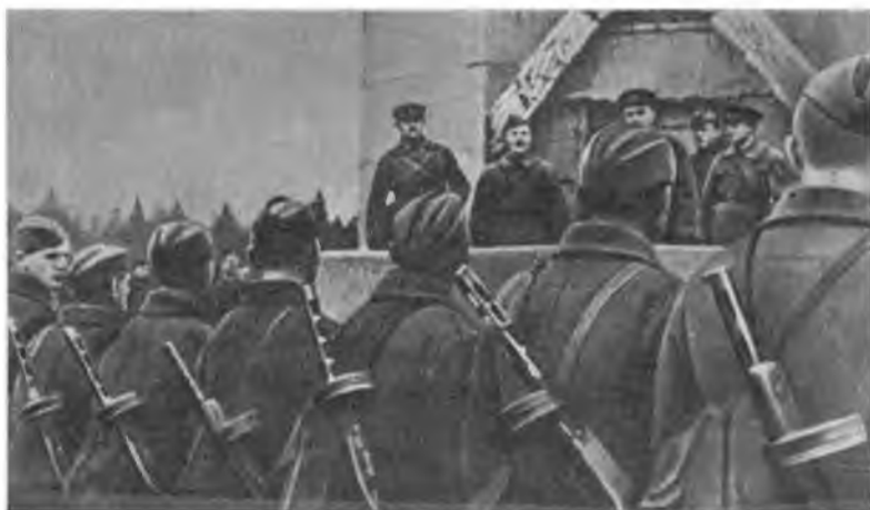
Митинг бойцов Ленинградского фронта у шалаша — памятника В. И. Ленину в Разливе. 1942 г. Кинокадр.