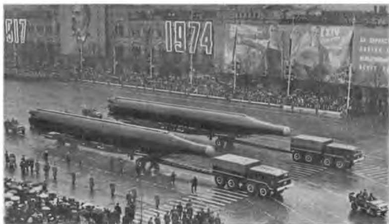
На марше ракетная техника.