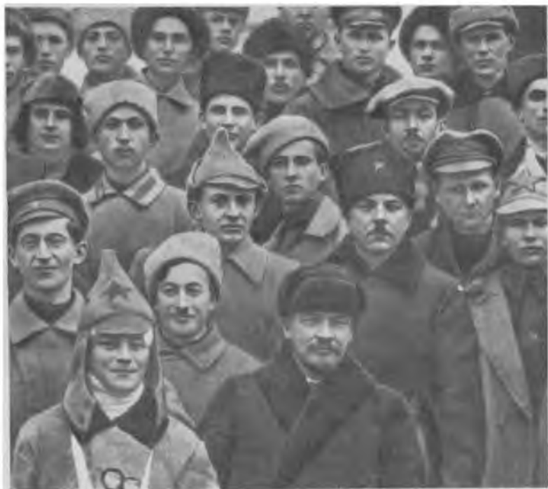
В. И. Ленин и К. Е. Ворошилов в группе делегатов X съезда РКП(б) — участников подавления Кронштадтского мятежа. Москва, март 1921 г.