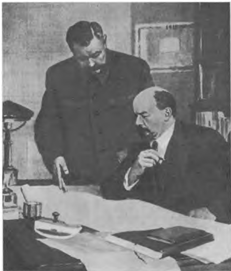
В. И. Ленин и Главнокомандующий Вооруженными Силами Республики С. С. Каменев.