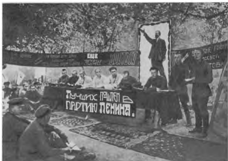
Прием в партию по Ленинскому призыву. Московский военный округ. 1924 г.