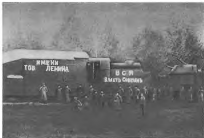
Бронепоезд «Имени тов. Ленина» на боевых позициях.