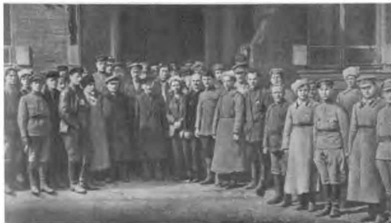
В. И. Ленин и М. И. Калинин в группе курсантов московских курсов тяжелой артиллерии Красной Армии. Апрель 1919 г.