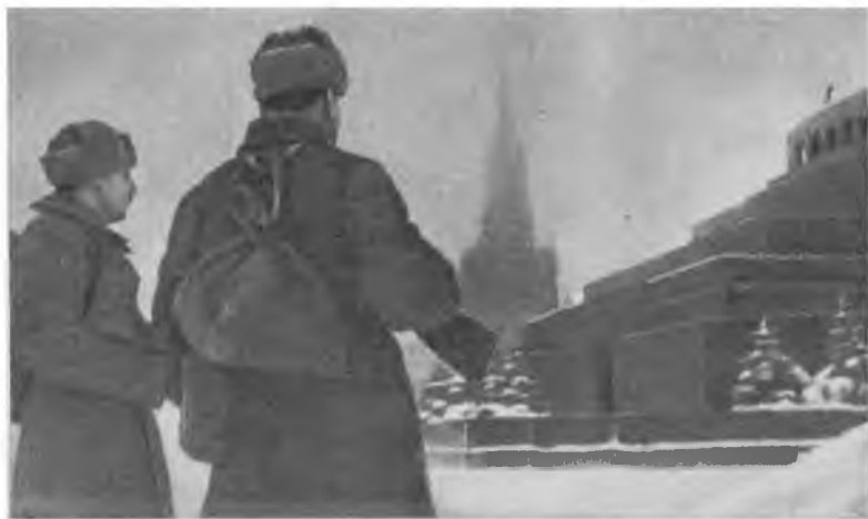
Перед отправкой на фронт. Москва, 1941 г.