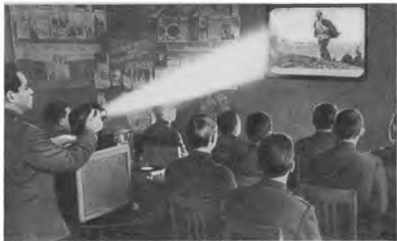
На экране — кадры о жизни и борьбе великого вождя.