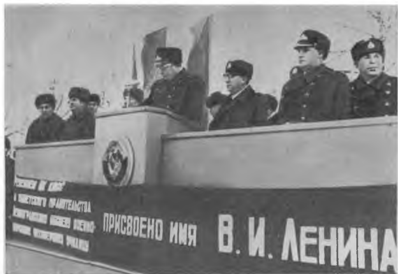
Училищу присвоено имя В. И. Ленина.