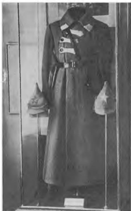
Центральный музей В. И. Ленина. Подарки Ильичу: военное обмун- дирование и модель винтовки, изготовленной на Ижевском оружейном заводе.