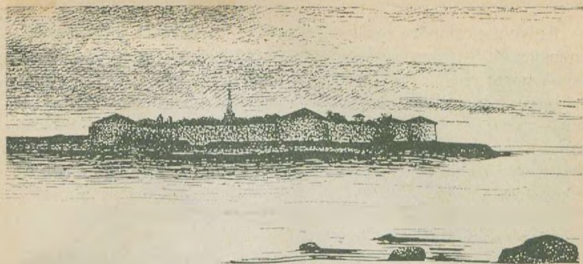
ШЛИССЕЛЬБУРГСКАЯ КРЕПОСТЬ (снимок, относящийся к 80-м годам).