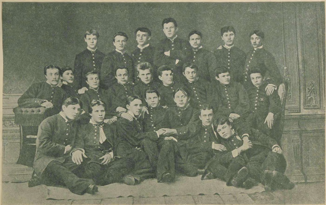
Группа окончивших Симбирскую гимназию в 1883 г. (× — А. Н. Ульянов).