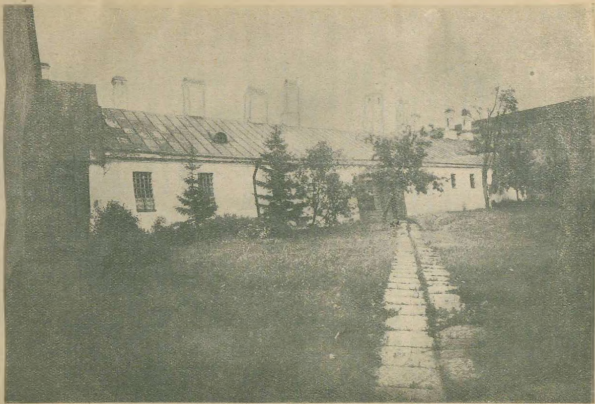
Здание старой тюрьмы в Шлиссельбурге, где осужденные по делу 1 марта сидели с 5—8 мая. Направо стена, подле которой они были казнены.