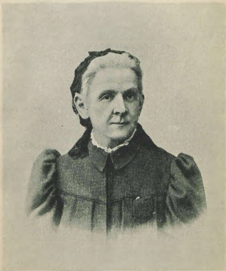
МАРИЯ АЛЕКСАНДРОВНА УЛЪЯНОВА (снимок 1898 года)