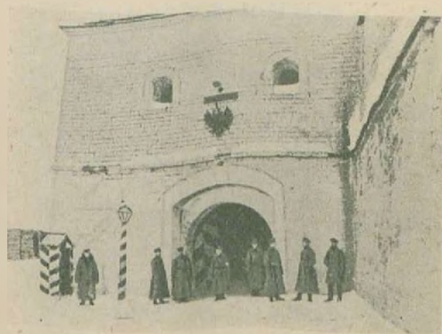
Вход в Шлиссельбургскую крепость. так называемые «Государевы Ворота».