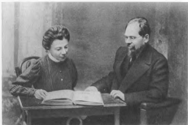
А. И. Ульянова- Елизарова и М. Т. Елизаров. 1915 г.