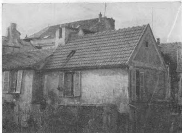
Лонжюмо. Дом, в котором жил Ленин

легальную большевистскую печать, выходившую в России, через русских рабочих, учившихся у него в Париже и в Лонжюмо, Ленин осуществлял практическое руководство партийными организациями России.