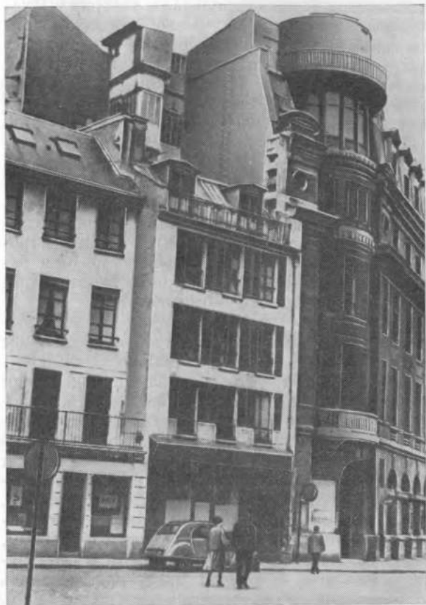
Париж, ул. Дантона, 8. В этом здании В. И. Ленин неоднократно выступал с рефератами