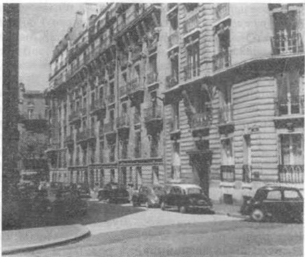
Дом № 4 на улице Мари-Роз