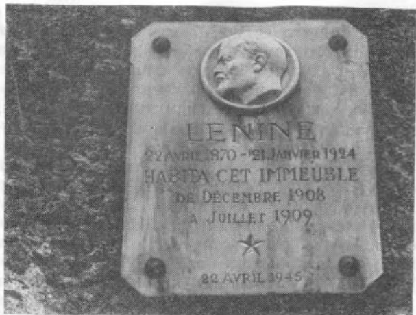
Мемориальная доска на доме № 24 по улице Бонье

ля дум, вождя столь абсолютного бескорыстия. Еще при жизни он вылил свою моральную фигуру в бронзу, которая переживет века» 14 .