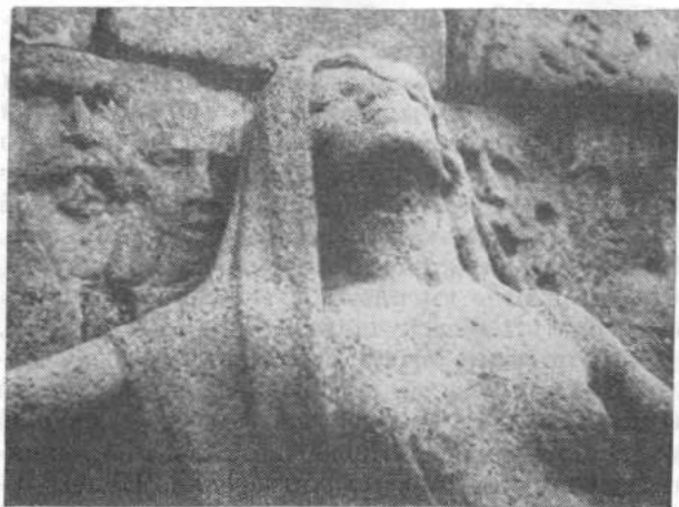
Фрагмент барельефа на Стене коммунаров

знамя коммунаров Московскому комитету партии 6 июля 1924 года, а 1 августа оно было торжественно перенесено в Мавзолей Ленина.