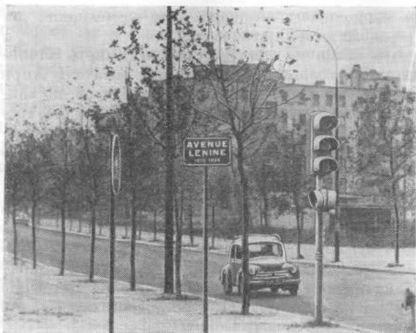
Проспект Ленина в предместье Парижа

«Известия» в Берлине от 1 февраля 1924 года мы читаем: «Я необычайно ценю великие личности и питаю к Ленину чувство живейшего восхищения. Я не знаю более могучей личности в Европе этого века. Он так глубоко направил руль своей воли в хаотический океан мягкотелого человечества, что еще долго его след не исчезнет в волнах, и отныне корабль, наперекор бурям, направляется на всех парусах вперед, к Новому Миру. Никогда еще после Наполеона европейская история не знала воли такой закалки. Никогда еще со своих героических времен европейские религии не знали апостола столь несокрушимой веры. И никогда еще человеческая деятельность не выдвигала властите-