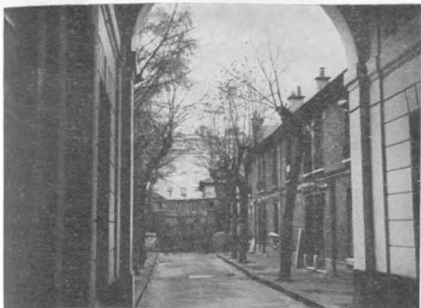
Типография на авеню д'Орлеан

которые могли быть использованы для размещения редакции.