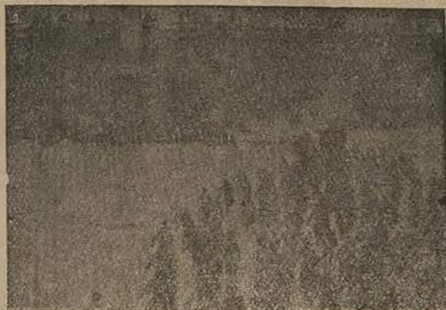
Октябрьские дни. Осада Зимнего дворца.

За ним выступили другие ораторы,—видимо, безо всякого порядка. Делегат от горнорабочих Донецкого бассейна приглашал С'езд принять меры против Каледина, который мог отрезать уголь и продовольственные припасы от столицы. Много солдат, только что прибывших с фронта, доводили до сведения С'езда полные энтузиазма приветствия от своих полков.