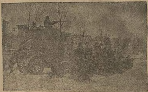
Улич н ы й б о й.

26 октября 1917 года мы приступили к сборке и отправке на фронт солдатских и красногвардейских полков. Смольный был буквально превращен в лагерь, где наспех формировались из присланных рабочих части. Тут же обмундировывались и вооружались, правильнее сказать, облачались в шинели, снаб-