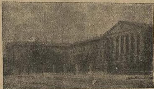
Общий вид Смольного, откуда шло руководство борьбы за пролетарскую революцию.

К концу «демократического совещания» был, по нашему настоянию, назначен срок второго С'езда Советов на 25 октября. При тех настроениях, какие нарастали с часу на час не только в рабочих кварталах, но и в казармах, нам казалось наиболее целесообразным сосредоточить внимание петербургского гарнизона на этой именно дате, как на том дне, когда С'ездом Советом должен будет решаться вопрос о власти, а