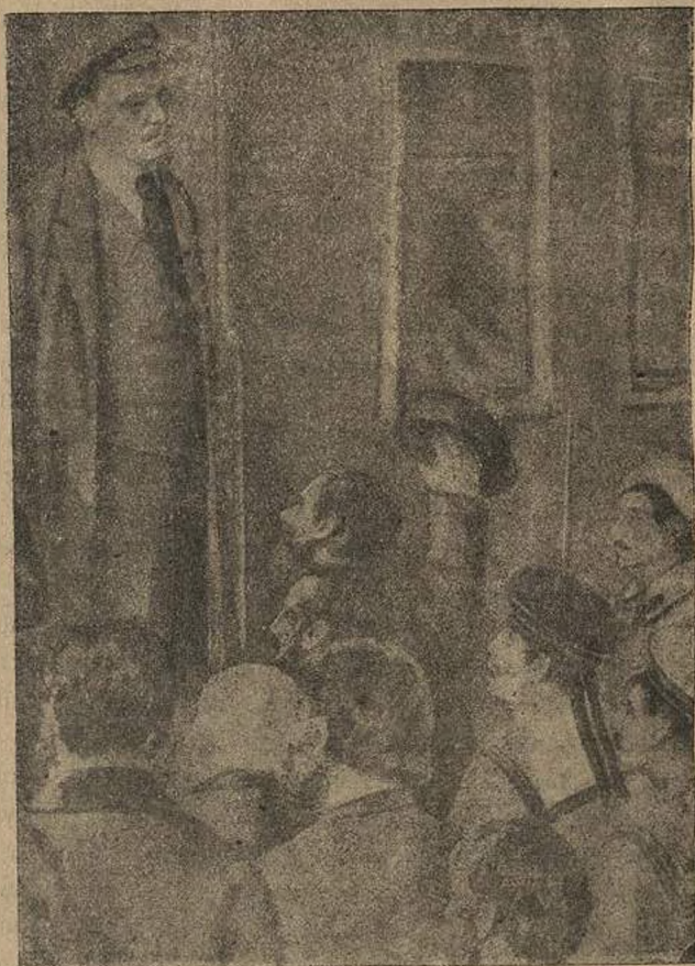
Приезд В. И. Ленина в Петроград в 1917 году. На Финляндском вокзале.