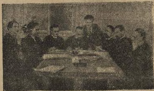
Члены Петроградского военно-революционного комитета в Октябрьские дни.

Советов, смешно и нелепо предупреждать врага о дне восстания. В лучшем случае 25 октября может стать маскировкой, но восстание необходимо устроить заранее и независимо от Съезда Советов. Партия должна захватить власть вооруженной рукой, а затем уже будет разговаривать о Съезде Советов. Нужно переходить к действию немедленно!