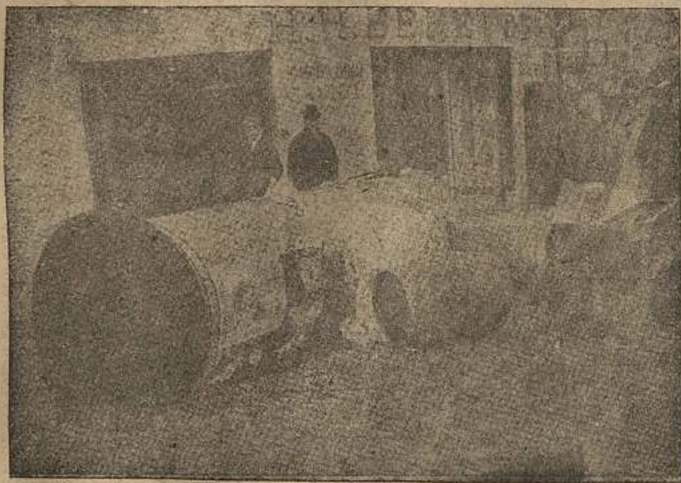
Баррикады на улицах в октябре.

— Не недоверие, а просто правительство рабочих и крестьян желает знать, как действуют его военные власти.