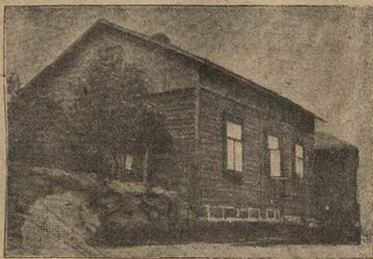
Дом в Таликкала, в Выборге, где Ильич проживал у т. Латуки с 30-го сент. по 20-ое окт. 1917 г.

От радости, что мне предстоит принять вождя русского революционного пролетариата, я шагал легко и быстро.