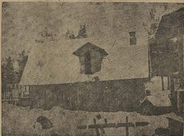
Внешний вид сарая, на чердаке которого скрывался тов. Ленин.

рий Евсеевич не опознали товарища, он же настаивает и говорит, что ему необходимо иметь свидание; держали совет, и решено было в случае чего пойти на крайность, но к счастью оказались свои. Таким образом, приходилось принимать товарищей, первое время подвергаясь постоянной угрозе прибытия непрошенных гостей; но, несмотря на все это, ни Владимир Ильич, ни Григорий Евсеевич не теряли присутствия духа и относились ко всем неудобствам весьма хладнокровно.