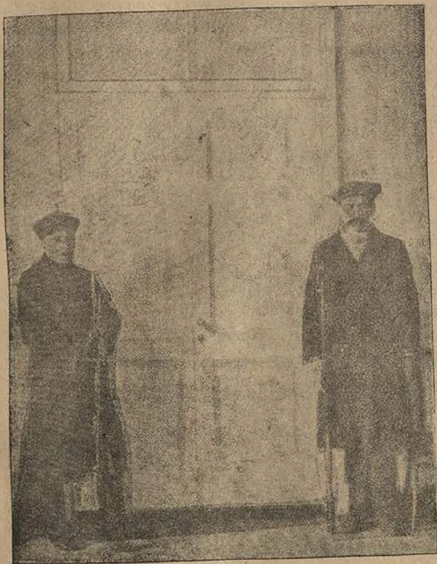
Рабочая охрана у кабинета В. И. Ленина в Смольном.

Время от времени стук в дверь: поступают сообщения о ходе событий; вопрос еще не решен—на нашей ли стороне победа, или нет; но соотношение сил вполне определилось—пере-