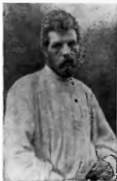
П. Н. Лепешинский.

передаточных адресов. Революционные социал-демократы подбирали в России наиболее надежных людей, находившихся вне подозрения полиции, а редакция «Искры», в свою очередь, находила подобных за границей. Через них велась вся конспиративная переписка. Подбирать такого рода адресатов начали незадолго перед выходом в свет «Искры», а точнее,