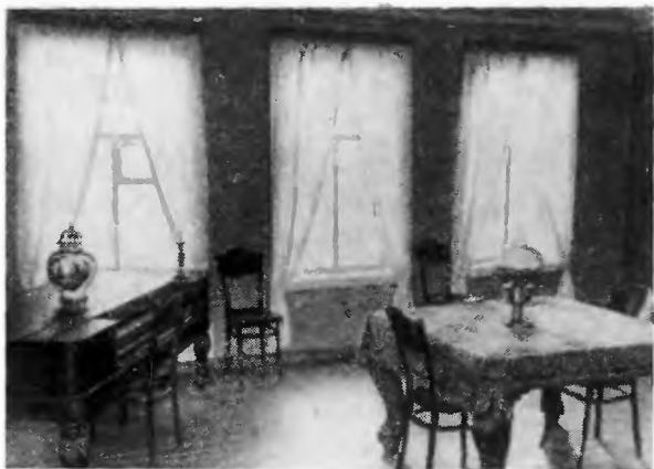
Комната в Музее-домике «Искры». Здесь в 1900 году В. И. Ленин встречался с псковскими социал-демократами.

проходило. Точная дата работы совещания до сих пор не установлена. Сопоставляя отдельные факты, относящиеся к деятельности участников Псковского совещания в то время, можно лишь попытаться несколько сузить эти рамки во времени. Из материалов департамента полиции явствует, что 28 марта 1900 года П. Б. Струве присутствовал в Петербурге на одном из вечеров, устроенных в пользу пострадавших от неурожая в южных губерниях 1 . Другой участник Псковского со-