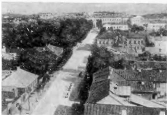
Архангельская улнца (ныне улица Леннна). Псков. 1900 год.

На рубеже XX века Псковская губерния представляла собой одну из наиболее отсталых губерний царской России. Местная промышленность была развита очень слабо. В губернии насчитывалось 1270 промышленных предприятий. Однако около тысячи из них составляли кустарные и ремесленные производства, на каждом из которых работало менее пяти человек. И только 270 предприятий можно было назвать фабриками и заводами. В основном они занимались переработкой сельскохозяйственной продукции и местного природного сырья. Наглядным подтверждением сказанного является приводимая ниже таблица.