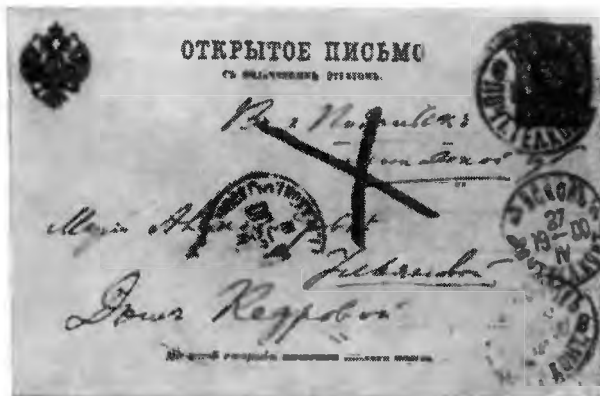
Почтовая открытка, посланная В. И. Лениным М. А. Ульяновой из Пскова в Подольск.

немца, по 50 к. за урок. Переводим с русского, немного говорим — не очень-то хорошо идет дело, и я подумываю уже не бросить ли; — пока, впрочем, посмотрю еще» 1 . Просто поражаешься, как при такой невероятной занятости В. И. Ленин находил еще время для совершенствования своих знаний в области немецкого языка.