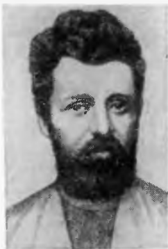
А. М. Стопани.

В частности, он предлагал дополнительно учредить новые должности, как-то: одного помощника полицмейстера в городе Пскове, 21 станового пристава, 42 помощников ста- нового пристава, одного полицейского надзи- рателя, 12 околоточных надзирателей и 79 урядников 2 .