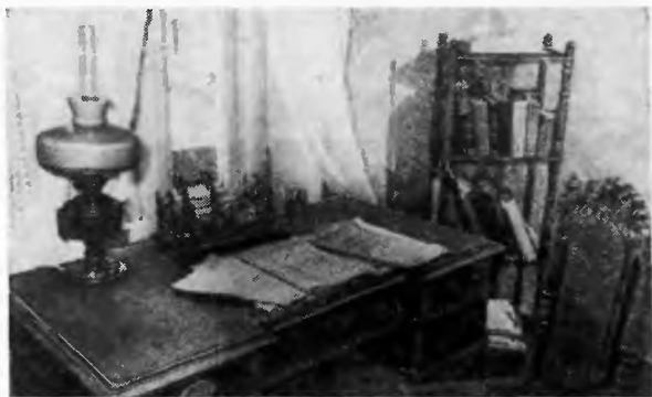
Комната-музей В. И. Ленина в Пскове.

Приехав в Псков с готовой программой действий, В. И. Ленин начал тщательно знакомиться с обстановкой на месте. Прежде всего он сколотил вокруг себя группу единомышленников. Дальнейшая задача заключалась в том, чтобы, изучив людей, привлечь на свою сторону тех из них, кто был близок к революционному марксизму.