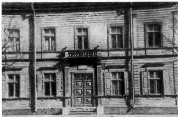
Дом в Риге по улице Цессу, 17, в котором весной 1900 года останавливался В. И. Ленин.

честве корреспондента «Искры» В. И. Ленин привлек местного статистика В. А. Оболенского. Ключом конспиративного шифра было избрано произведение Лермонтова «Ангел». Этим шифром Оболенский воспользовался, направляя корреспонденцию в «Искру», уже живя в городе Орле 1 .