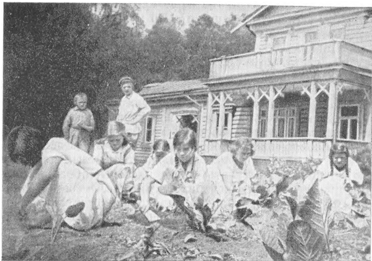
Юнресовцы за работой на огороде.

воспитанников оказался тринадцатилетний парнишка, который, хотя и носил пионерский галстук, отличался недисциплинированностью, неуживчивостью. Он уже побывал в трех детских домах, везде ссорился с товарищами, не подчинялся распорядку дня. Не раз обсуждали его поведение на совете отряда — главном органе самоуправления пионердома, на общем отрядном сборе. Ничего не помогало. Некоторые члены совета отряда, наконец, внесли предложение: давайте попросим перевести его в обычный детский дом, он звание нашего пионерского дома позорит.