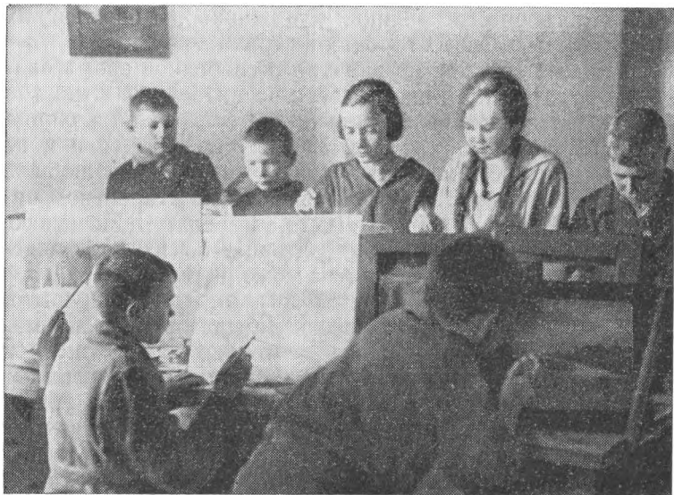
Воспитанники «Юной республики» на занятиях в изокружке.

игры выносливости, ловкости, смекалки. Часами ребята могли бегать, прятаться, упражняться в меткости. Увлекались и спортивными играми. Правда, долго не было в детдомах настоящего спортивного инвентаря. Только в конце 20-х годов пришел к ним волейбол и баскетбол. А вот в футбол, чаще всего мячами, сделанными из тряпок, из обрезков кожи, мальчишки играли целыми днями. И наловчились, случалось обыгрывали своих соперников из соседних поселков и деревень. Любили воспитанники и зимние виды спорта — лыжи, коньки. Настоящих лыж тоже долго не было. Делали их сами: приколачивали ремешки к дощечкам от разломанных старых бочек. Без палок, на таких самоделках уходили в горо-