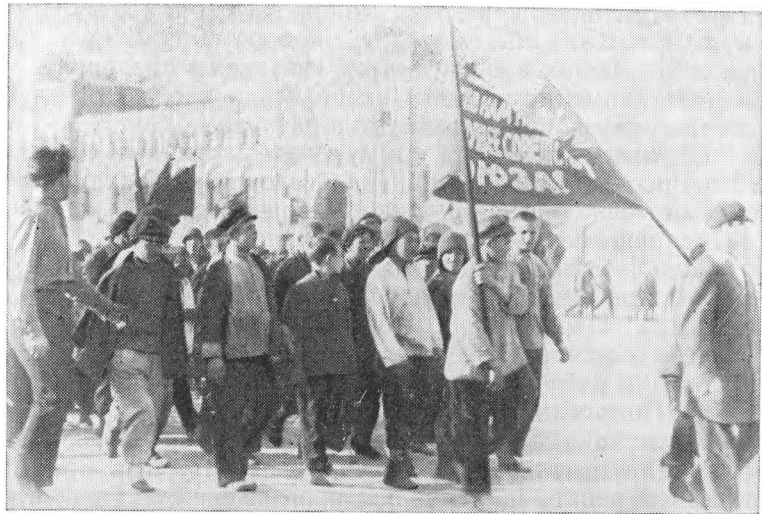
Бывшие беспризорные на Красной площади в Москве. 1925 г.

него гудка во всех цехах кипела работа. Не было ни одного уклонившегося. Дружно поработали краснобогатырцы. 175 тысяч рублей передали они в фонд недели. А закончился воскресник кратким митингом и пением «Интернационала» 86 .