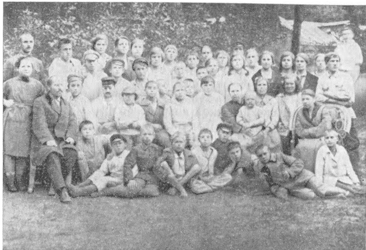
Пушкинская детская сельскохозяйственная колония. 1923—1924 гг.

муны — благоустройство, оборудование помещений мебелью, содержание воспитанников удовлетворяются исключительно силами коллектива. Для достижения этих целей организуются мастерские, проводятся работы в поле, в саду, на огороде» 2 .