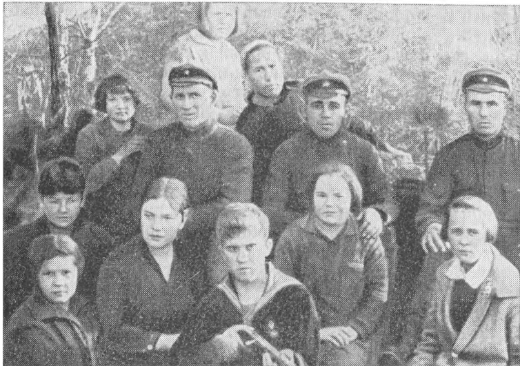
Воспитанники «Юной республики» с шефами-красноармейцами.

но» 14 . И дальше в решении — распределение заданий: кто будет чинить электропроводку в пока еще неблагоустроенном здании, кто заготавливать топливо, кто приводить в порядок двор и т. д.