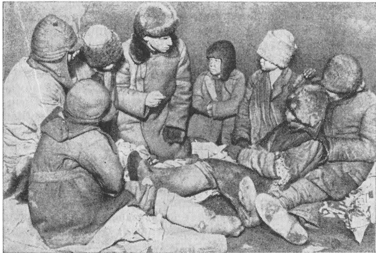
Беспризорные дети. 1924 г.

ситься бережно даже к тем, кто невольно стал на путь нарушения законов. «Для детей в Советской России нет ни судов, ни тюрем» 11 , — напоминала Деткомиссия в одном из своих обращений ко всем исполкомам Советов и уполномоченным по борьбе за улучшение жизни детей.