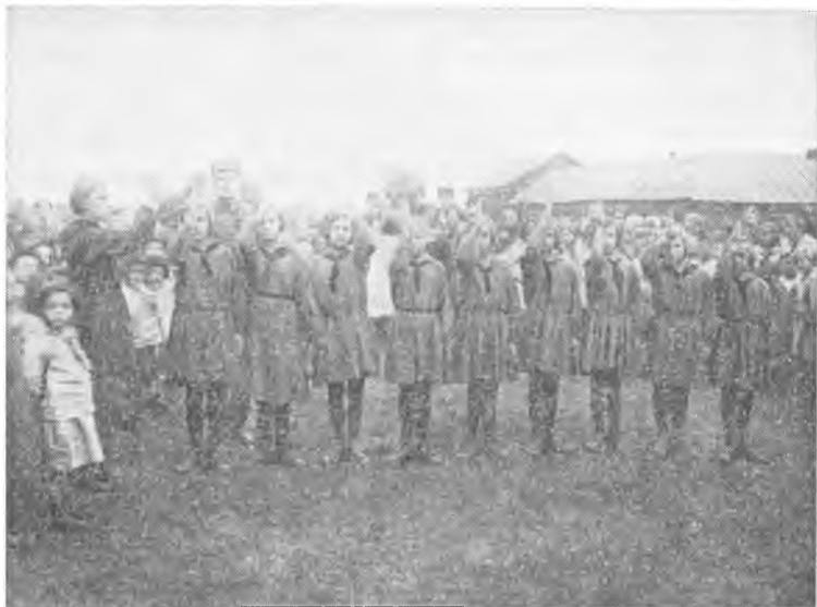
Пионеры детского дома «Спартак» дают торжественное обещание.

пропаганду, общее и агрокультурное образование, определил конкретные пути осуществления этого плана. Съезд указал на необходимость распространения общей политической и специально для крестьян издаваемой литературы и газет, использования всех видов внешкольного образования и просвещения взрослого населения, включая и художественное 19 .