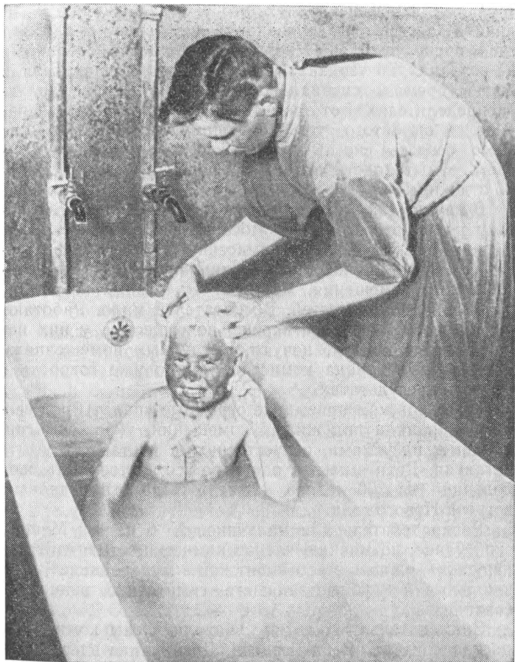
В санитарной комнате Покровского детприемника.