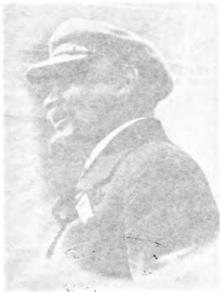
В. И. Ленин в 1920 г.