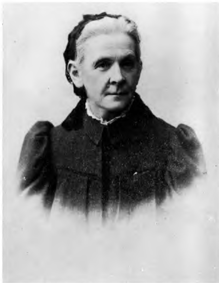
Мария Александровна Ульянова 1898 г.