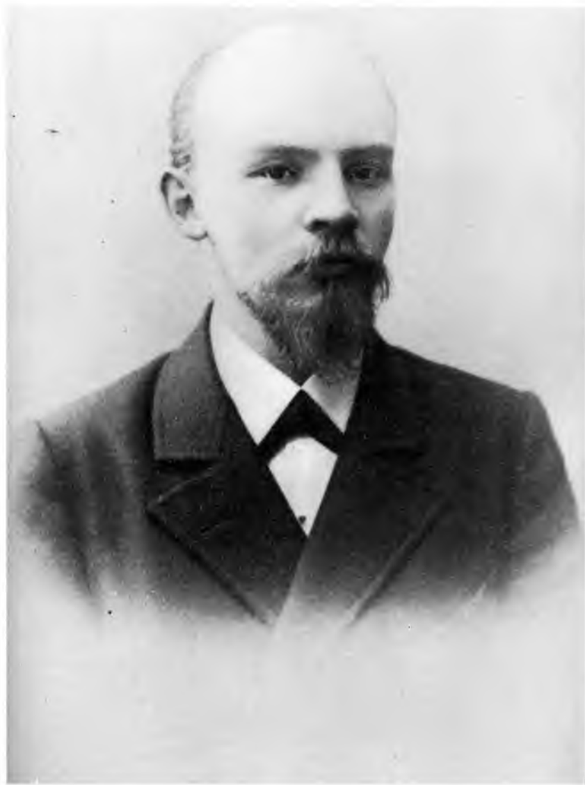
Владимир Ильич Ульянов 1900 г.