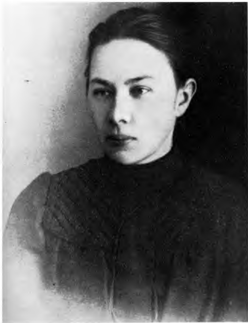
Надежда Константиновна Крупская 1900 г.