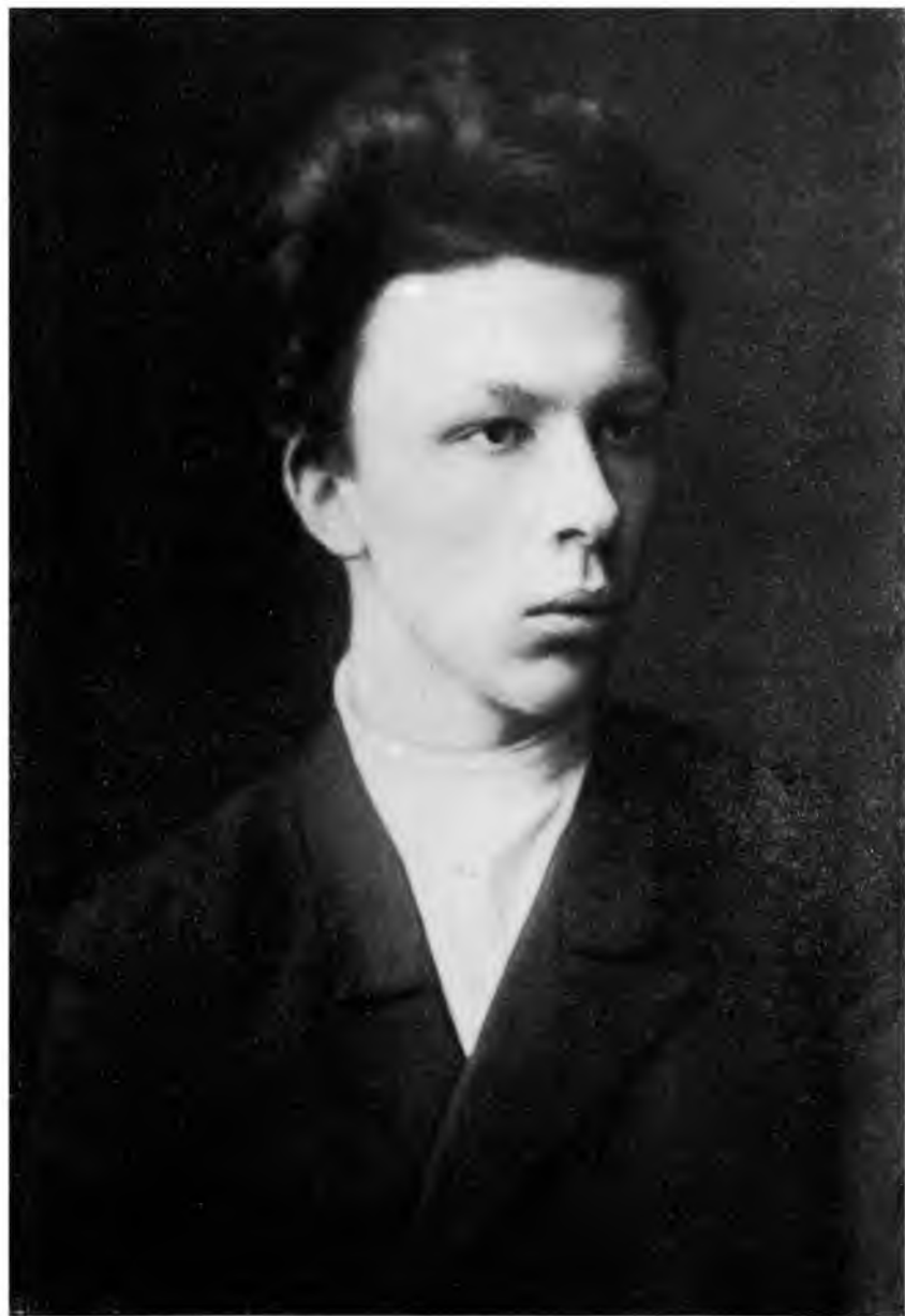
Александр Ильич Ульянов 1887 г.