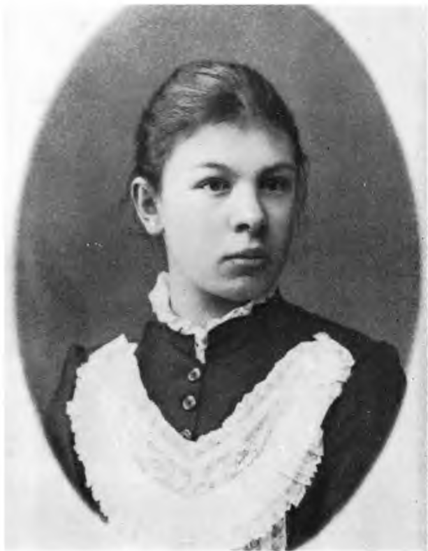
Ольга Павловна Ульянова 1887 г.