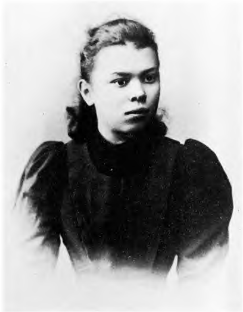
Мария Ильична Ульянова 1895 г.