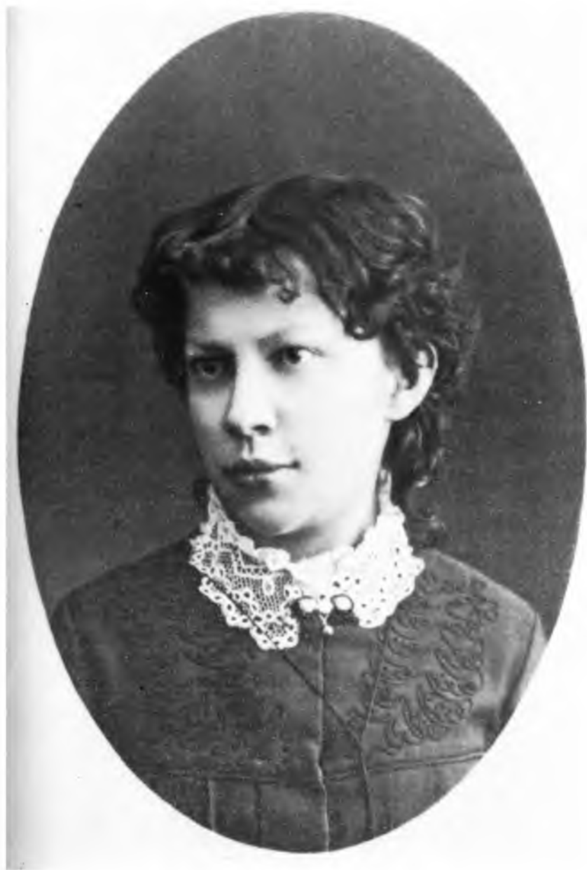
Анна Пльнична Улянова 1883—1887 гг.