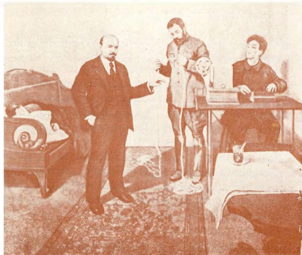
В. И. Ленин у прямого провода. С картины И. Грабаря