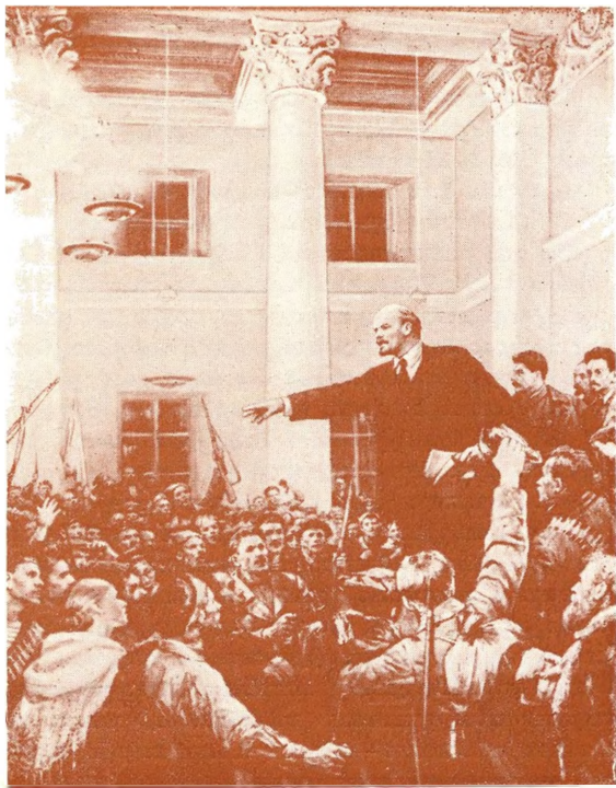
В. И. Ленин на II съезде Советов. С картины В. Серова