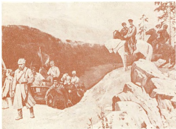
Рейд Блюхера. С картины Р. Нурмухаметова