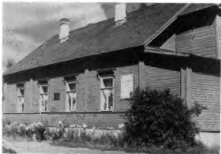
Псков. Дом на Плехановском (бывш. Петровском) посаде, где В. И. Ленин провел первое совещание по организации газеты «Искра» и журнала «Заря».