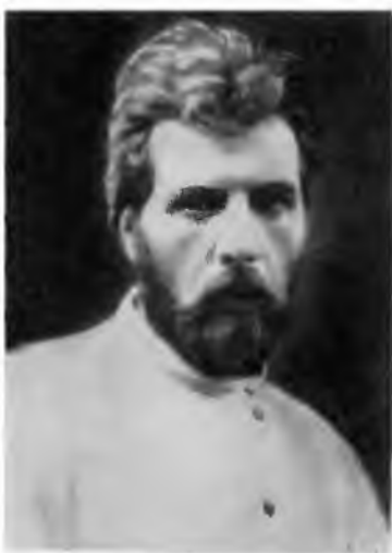
И. И. Лепешинский