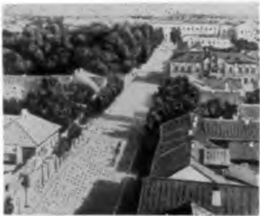
Псков. Архангельская ул. (ныне ул. Ленина) Фото 900-х годов.