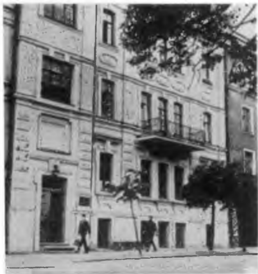
Псков. Дом по ул. Ленина, 3, где располо- жена квартира-музей В. И. Ленина. На третьем этаже второе слева окно комнаты, которую занимал В. И. Ленин в 1900 г.