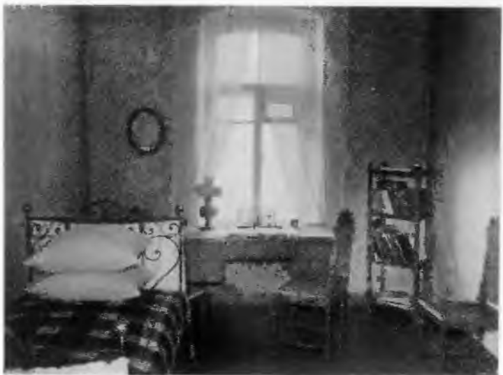
Комната В. И. Ленина.