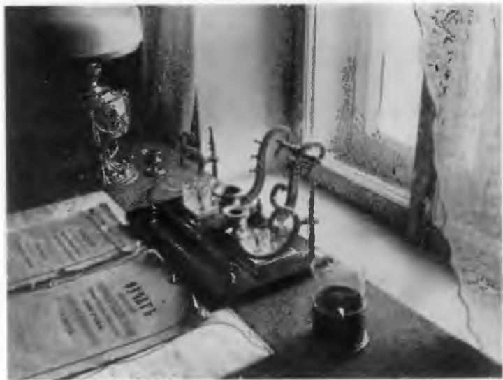
Письменный стол В. И. Ленина, где он жил в 1900 году.