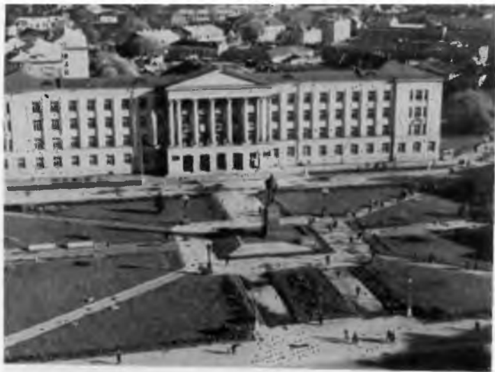
Нисков. Площадь В. И. Ленина. Фото 1969 года.