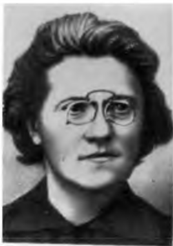
О. Б. Лепешинская.