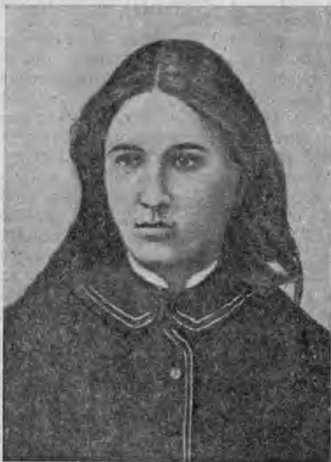
Вера Ивановна Засулич.

экономически слабая — какими чудесными способами она может стать во главе государственного правления? — спрашивает Тихомиров и отвечает, что неудачи всех попыток буржуазии подойти к власти заключаются в слабости буржуазии: неспособность „поставить на прочную ногу наше производство, поставить посредством него в экономическую от себя зависимость массу народа, выработать себе, наконец,