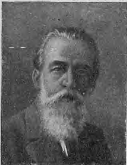
Дмитрий Николаевич Благоев.

Понятно, что новой группе революционного движения необходимо было позаботиться как о выработке своей программы, так и о постановке своего органа, где можно было бы откликнуться на все важнейшие теоретические и практические вопросы дня. Действительно, благоевцы в течение 1884 года вырабатывают проект своей программы, посылают его группе „Освобождение Труда“ и „Народной Воле“ и готовят издание своего органа, который и выходит под названием „Рабочий“ в январе 1885 года.