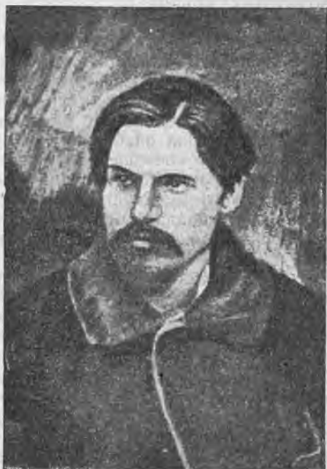
Степан Николаевич Халтурин.

скую земскую школу („Вятское земское училище для распространения сельско-хозяйственных и технических знаний“), преобразованную впоследствии в реальное училище. Отсюда он вышел через год, не окончив ученья, и в 1875 году, не удовлетворенный своей жизнью, он задумал поездку в Америку с некоторыми из своих товарищей. Поездка не удалась, и Халтурин один, без паспорта и без денег, оказался в Москве. Здесь он попал на железную дорогу, в мастерские, где и работал с тех пор, как рабочий столяр, воспользовавшись той выучкой, какую он получил еще дома и в земской школе. В рабочей среде Халтурин и превратился в того замечательного русского рабочего, каким его знает история русского революционного движения.