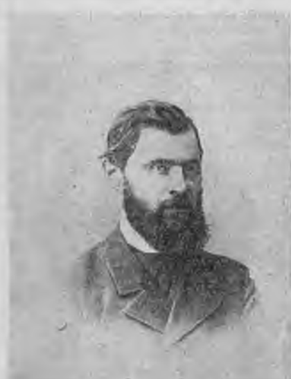
Павел Борисович Аксельрод.

уже не так незначительны, как это может показаться из письма к ним 1 . Так говорит Плеханов, и хотя, быть может, ему самому и его сторонникам казалось, что „Народная Воля“ должна возвратиться к старым своим воззрениям, о чем далее говорится в письме, дело, однако, как раз сводилось к тому, что Плеханов в то уже время являлся настоящим сторонником учения Маркса, а народники попрежнему оставались сторонниками мелкобуржуазных социалистов вроде Прудона. Эту разницу в своих воззрениях и во взглядах Кравчинского, одного из будущих редакторов, и подчеркивает Плеханов: „Он что-то вроде прудониста, я — не понимаю Прудона; характеры наши тоже не совсем сходны: он человек, относящийся в высшей степени терпимо ко всем оттенкам социалистической мысли, я готов создать из «Капитала» прокрустово ложе для всех сотрудников «Вестника Народной Воли» 2 .