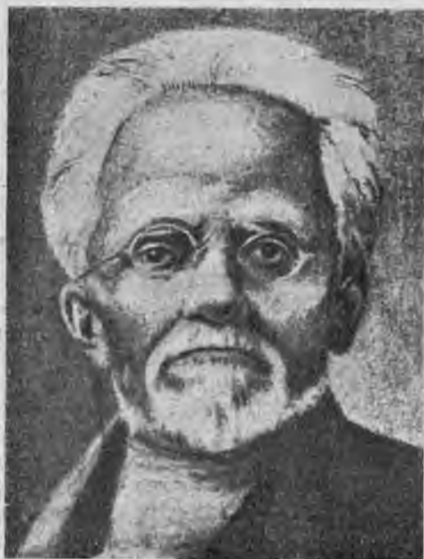
Петр Анисимович Моисеенко.