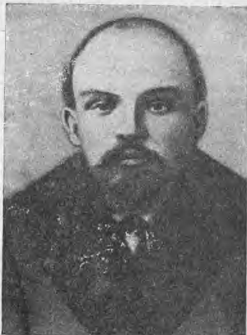
В. И. Ленин.

„Наш автор на данных трех уездов Таврической губернии произвел анализ крестьянского хозяйства в этих уездах, взятых во всем целом, и показал всю глубину расслоения тогдашней деревни в многоземельном и плодородном южном черноземном районе: \frac{1}{5} всех зажиточных крестьянских хозяйств, засевающих более 25 десятин, пользуются половиной всей земли, находящейся в пользовании крестьян, \frac{2}{5} средних хозяйств, засевающих от 10 до 25 десятин, пользуются \frac{2}{5} земли, а \frac{2}{5} бедных и беднейших крестьян, засевающих менее 10 десятин, пользуются всего \frac{1}{5} всей земли. Богатые крестьяне нанимают работников, а бедные нанимаются в работники; богатые имеют много скота, применяют в своих хозяйствах жатки, косилки и др. земледельческие орудия, ведут более рациональное и выгодное хозяйство, побивая этим на рынке бедноту, захватывая все больше и больше земли покупкой и арендой и тем лишая ее бедноту. Средняя группа является неустойчивой: немногие из нее имеют шансы перейти в высшую группу—сельской буржуазии, а большинство опускается в низшую группу, являющуюся классом наемных рабочих с наделом.