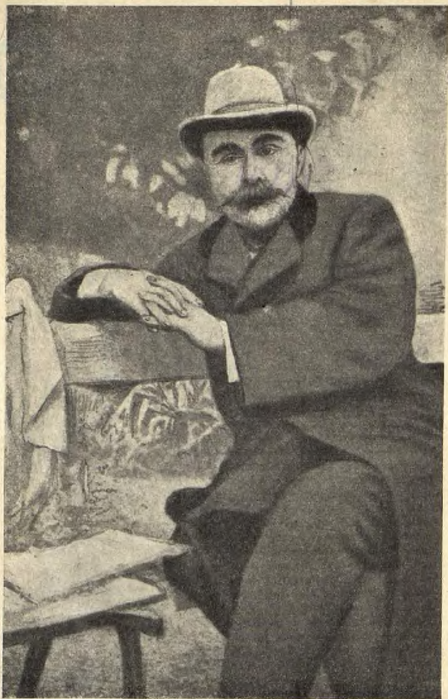
Г. В. ПЛЕХАНОВ РОДОНАЧАЛЬНИК РУССКОГО МАРКСИЗМА