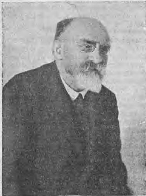
Д. Б. Рязанов.